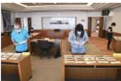
1つ、1つといねいに目を通します