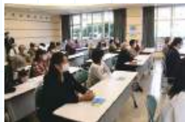
多くの方が参加されました