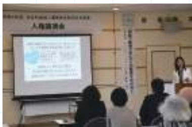
スライドを使った、わかりやすいご講演でした