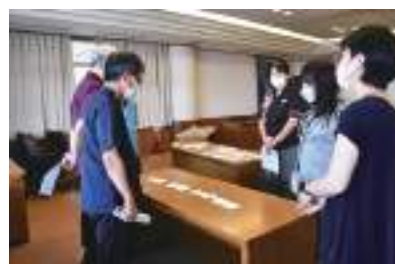
難航しています・・