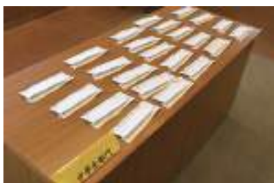
一次審査で残った作品の数々