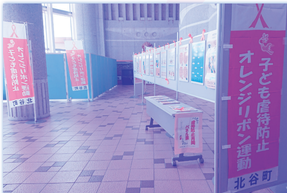
▲子ども家庭課は児童虐待防止パネル展を開催