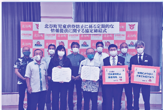
▲子ども家庭課では、町立の幼小中学校と児童虐待防止に係る情報共有に関する協定を結びました。