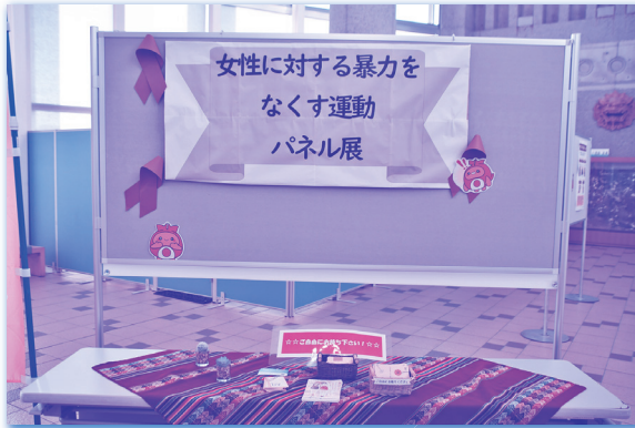
▲令和2年度北谷町女性に対する暴力をなくす運動パネル展を開催

http://www.gender.go.jp/policy/no_violence/ 内閣府男女共同参画局ホームページ