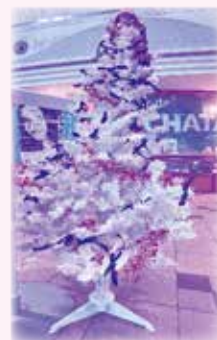
パープルリボンで飾られたツリー

令和3年度は、女性に対するあらゆる暴力をなくしていこうというメッセージを込めて、ツリーにパープルリボンを飾ってPRしました。