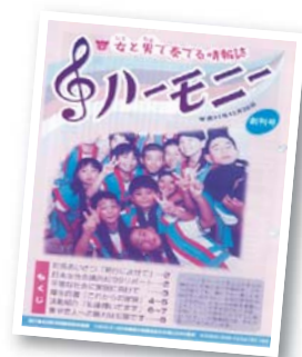
（ハーモニー創刊号）