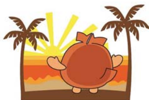
北谷町イメージキャラクター ちーたん

発行(平成28年8月)/北谷町 総務部町長室 〒904-0192 沖縄県中頭郡北谷町字桑江226番地 TEL: 098-936-1234 FAX: 098-936-7474 ホームページURL http://www.chatana.jp/yakuba/