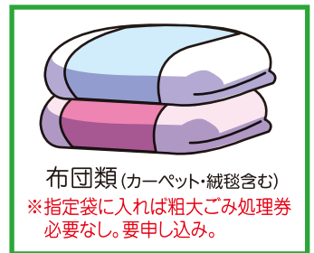
布団類 (カーペット・絨毯含む)