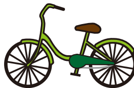
自転車・三輪車など