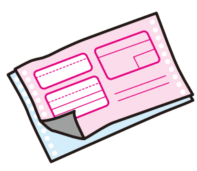
再生の効かない紙