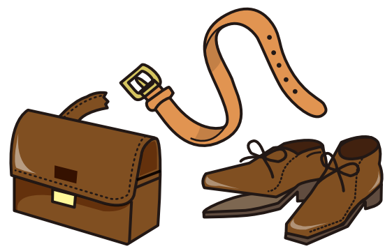
鞆・靴などの革・ゴム製品