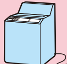
洗濯機・ 衣類乾燥機