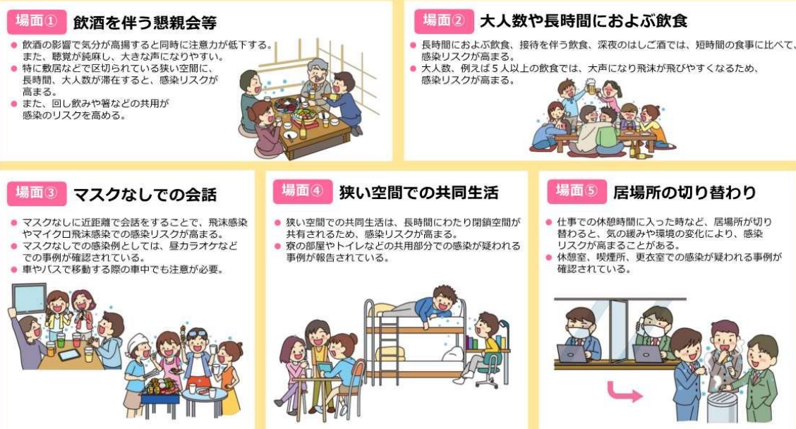
図2 感染リスクが高まる「5つの場面」（内閣官房のウェブサイトより一部抜粋）