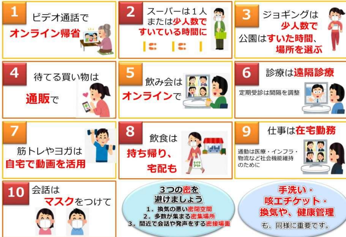
図1 人との接触を8割減らす、10のポイント（厚生労働省のウェブサイトより一部抜粋）

緊急事態宣言の中、誰もが感染するリスク、誰でも感染させるリスクがあります。 新型コロナウイルス感染症から、あなたと身近な人の命を守るよう、日常生活を見直してみましょう。