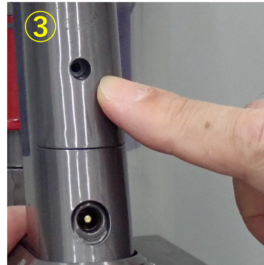
③ビス留めは行わない