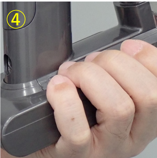
④手のひらをバッテリーパック底面、指をバッテリーパック上面にあてがう