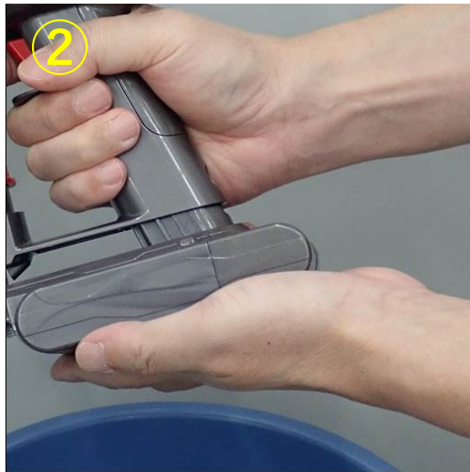
②バッテリーパックを掃除機に装着