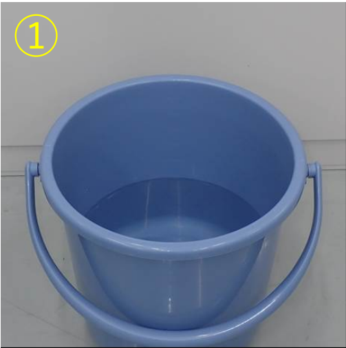
①水を張ったバケツを準備