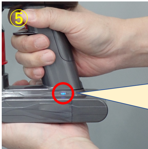
⑤バケツの上で、電池切れになるまで掃除機を運転

運転中、パイロットランプは「点灯」します。電池切れになると、パイロットランプが「点滅」状態になります。