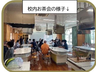
校内お茶会の様子↓