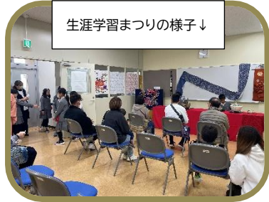
生涯学習まつりの様子↓