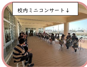
校内ミニコンサート↓