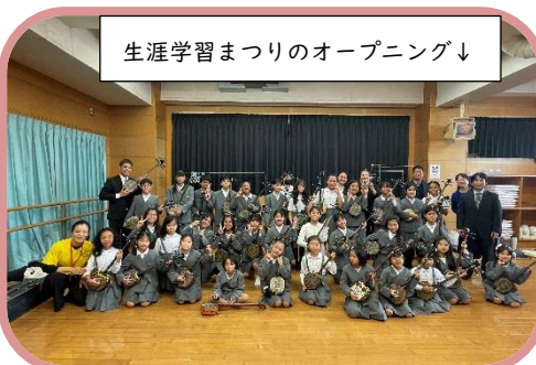
生涯学習まつりのオープニング↓