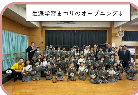
生涯学習まつりのオープニング↓