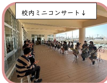
校内ミニコンサート↓