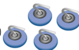
ジェットローラー