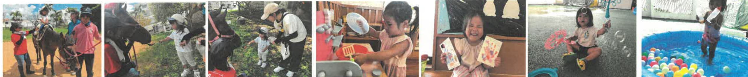
乗馬えさやり体験