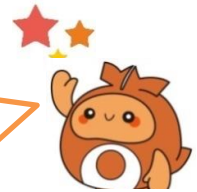
北谷町イメージキャラクター ちーたん

3歳から5歳までのお子さまは、給食費(主食費+副食費)の実費徴収があります。 「徴収金額」「徴収方法」は、施設ごとに異なりますので、直接、各施設にお問合せ下さい。