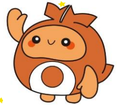
北谷町イメージキャラクター ちーたん

※私立幼稚園・認定こども園1号認定の方は、在園児・新規児童ともに、施設を通して申込みをお願いします。 継続在園児については、感染防止のため可能な限り以下の期間にお申込をお願いします。