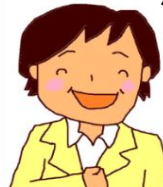
主任ケアマネジャー

ケアマネジャーへの支援や助言、主治医や地域機関との連携体制作りなどを支援し、高齢者のみなさんが自立につながるサービスが提供できるように支援します。