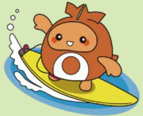
ちーたん (北谷町イメージキャラクター)