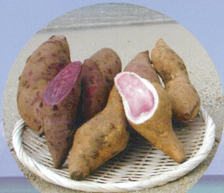
サツマイモ (紅イモ含む)