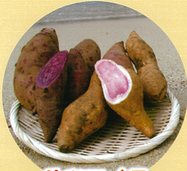
サツマイモ (紅イモを含む)