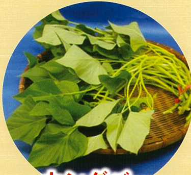
カンダバー (サツマイモの茎・葉)