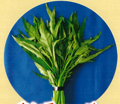
ウンチェーバー (ヨウサイ)