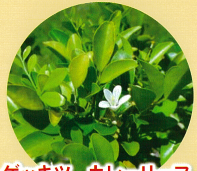
ゲッキツ、カレリーフ の苗・枝・葉