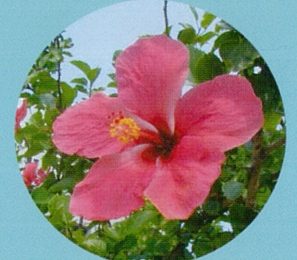
ハイビスカスの苗木

上記の植物は一例です。サツマイモは蒸熱処理をすれば、カンキツ・ゲッキツ等は検査に合格すれば持ち出せますが、必ず事前にお問い合わせください。