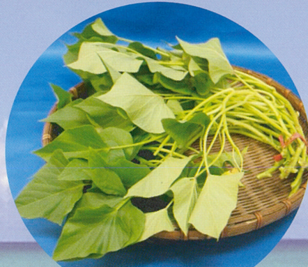
サツマイモの茎・葉 (カンダバー)