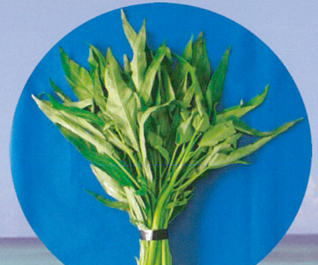
ヨウサイ (ウンチェーバー)