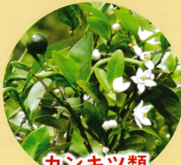
カンキツ類 の苗・枝・葉