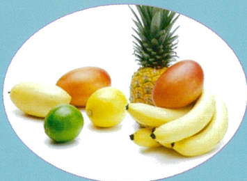
くだもの (マンゴー、パパイア等)