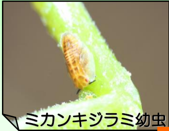
ミカンキジラミ幼虫

ミカンキジラミ が病気を移したり、病気の木からの 取り木 や 接ぎ木 によって感染します。感染した木は治療ができないため、 速やかに伐採処分 することが病気の蔓延を防ぐのに重要です。