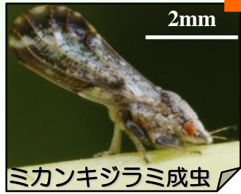
ミカンキジラミ成虫