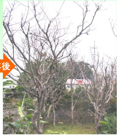
病気にかかったシークワサー