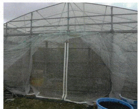
ファスナー付きカーテン