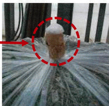
ビニール袋の口をしっかりと閉める