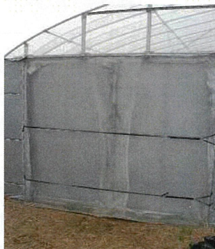
二重カーテン+留め具