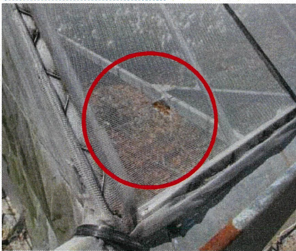
ネット等の破れの補修