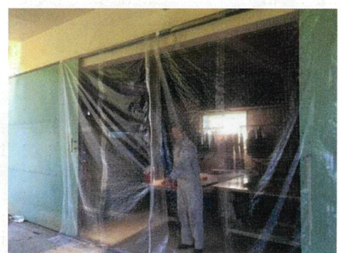
集荷場入口のネット設置