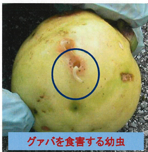
グアバを食害する幼虫