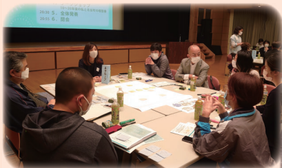
第1回まちづくりミーティングのようす