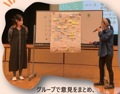
グループで意見をまとめ、 発表しました!