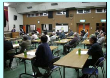
まちづくり説明会（第2回）の様子