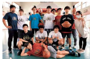
(桑江区広報 通信員 與那嶺 梨恵)