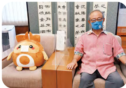
マスクを着けましょう。