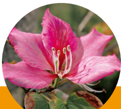
《町花》ファイリソシカ

人口 28,974人 (+4) | 男 13,904人 (+0) | 女 15,070人 (+4) | 世帯数 12,537世帯 (+8)