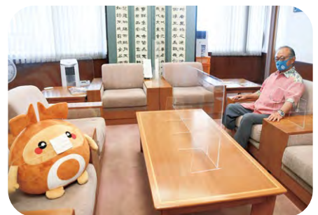
ソーシャルディスタンスを心がけましょう。