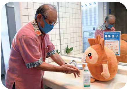
手を洗いましょう。