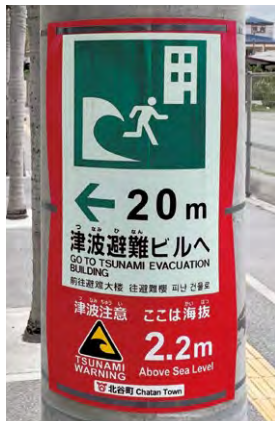
電柱巻き付け式避難表示