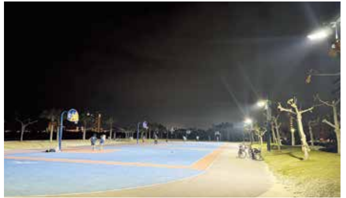
寄贈されたLED照明で照らされるアラハビーチのバスケットボールコート。 LED照明は沖縄アリーナと同じMusco Lighting Japan®製