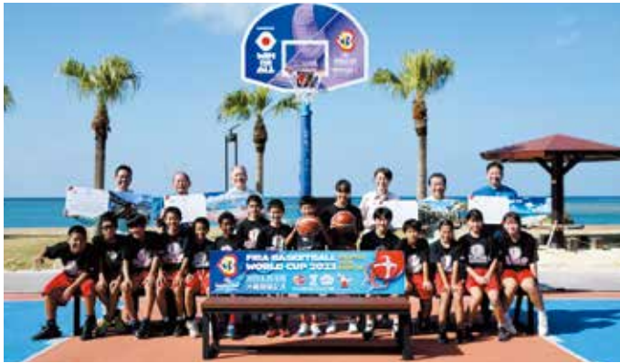
後段左側から、古謝那覇副市長、松川宜野湾市長、沖縄県バスケットボール協会日越会長、日本バスケットボール協会三屋会長、桑江沖縄市長、渡久地町長、前段は、北玉ミニバスケットボール部の子ども達

当プロジェクトは、この活動目的に賛同いただいた多くの県内県外の企業の皆様の寄付により成り立っており、今回の寄贈のほかにも、沖縄県内離島在住の多くの子ども達をFIBAバスケットボールワールドカップ2023の試合に無償で招待を行っています。