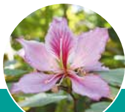
《町花》フリーソシンカ

人口 29,093人 (+31) | 男 13,859人 (+6) | 女 15,234人 (+25) | 世帯数 13,042 世帯(+39)