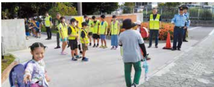
あいさつ運動中の児童等に対する北谷町長及び沖縄警察署長等による激励(北谷第二小学校前)