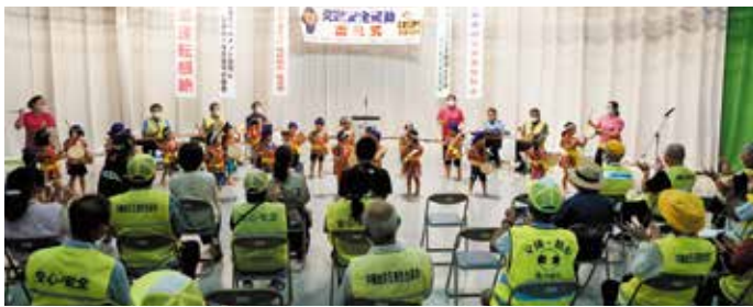
夏の交通安全県民運動出発式及び交差点でのチラシ配布とアイキャッチ

交通事故のない安全で安心な北谷町を実現するためには、ドライバー、自転車利用者及び歩行者の皆様が交通ルールとマナーを守ることが大切です。皆様のご協力を宜しくお願いします。