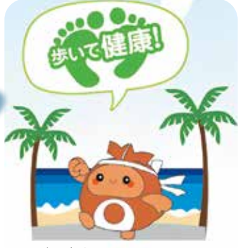
ちやたん(北谷町イメージキャラクター)