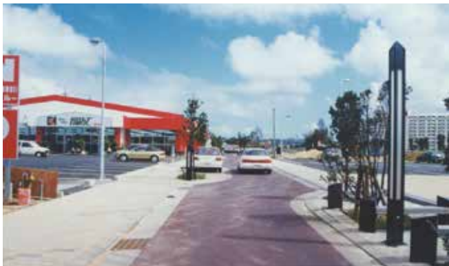
[掲載資料]写真: A7002261098 コミュニティ道路(1993年)

現在の美浜一丁目から三丁目までの区域は、1945年(昭和20年)から1981年(昭和56年)12月までの36年間メイ・モスカラ射撃場として使用されていました。