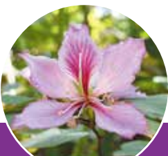
《町花》フイリソシンカ

人口 29,054人 (-45) | 男 13,851人 (-17) | 女 15,203人 (-28) | 世帯数 12,954 世帯(-13)