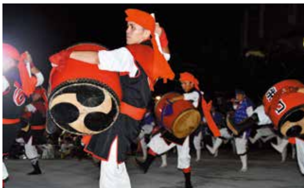
北谷町青年連合会