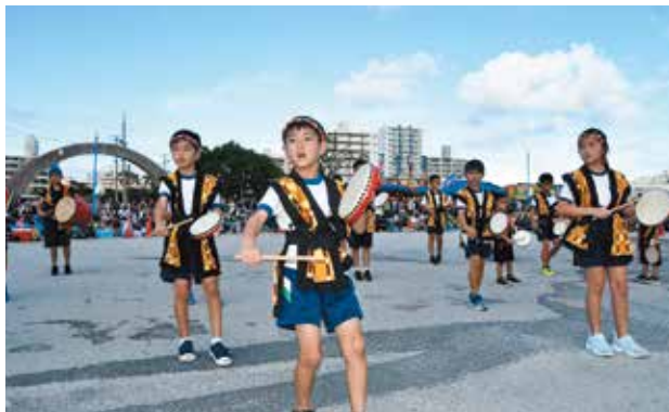
砂辺区子どもエイサー

イベントでは、北谷町内の青年会2団体の演舞に加え、砂辺区子どもエイサー演舞や伝統芸能「砂辺のあやぐ」の披露、町外の青年会の友情出演があり、会場は多くの人でにぎわいました。フィナーレのカチャーシーでは観客と演者が一体となって盛り上がり、花火の打ち上げとともに大盛況に終わりました。