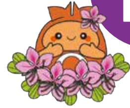
北谷町イメージキャラクター ちーたん