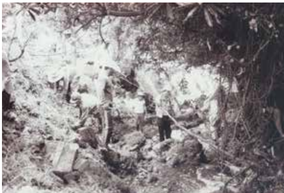
[掲載資料]写真: A7002040119 白比川の清掃(1983年)

北谷城の丘陵北側から安良波海岸へ流れる白比川は、戦前は豊かな水量にフナ・エビなどの小動物が多く生息し、地域の住民にとっては農業用水や洗濯・水浴びなどの生活用水として利用し、子どもたちの遊び場として親しみのある川でした。しかし戦後は、米軍基地建設に伴う土砂や排水・油汚染と、流域の急速な都市化による生活排水の流入により汚濁が急激に進みました。この状況を憂慮した町民の元の美しい川を未来へ残したいという声や意識の高まりにより、1983年(昭和58年)6月10日に主に地域のボランティアで組織された「白比川の自然を残す会」が発足しました。その後、活動の成果もあり白比川の汚染は緩和され水生生物の固体数や種類の回復が観察されるようになりました。