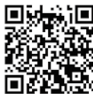
北谷町 マイナポイント ページはこちら