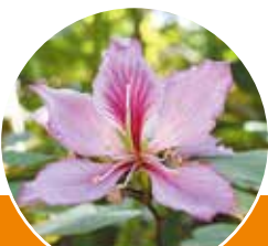
《町花》フイリソシンカ

人口 29,099人 (-8) | 男 13,868人 (+9) | 女 15,231人 (-17) | 世帯数 12,967 世帯(+15)