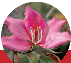
《町花》フィリソシンカ