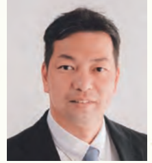
北谷町長 渡久地 政志

明けましておめでとうございます。町民の皆様におかれましては、2023年・令和5年の輝かしい希望に満ちた新年をお迎えのこととお慶び申し上げます。皆様におかれましては、日頃から本町まちづくり行政に対し、ご理解・ご協力を賜り心から感謝申し上げます。