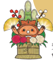
北谷町 イメージキャラクター ちーたん