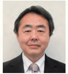
北谷町教育委員会 教育長