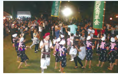
(謝苅区広報通信員 富銘擴)