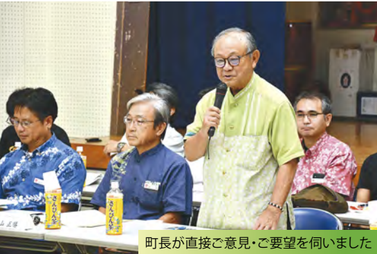
町長が直接ご意見・ご要望を伺いました