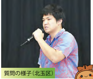
質問の様子(北玉区)