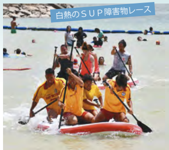
白熱のSUP障害物レース