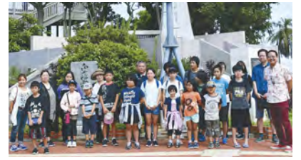
(宇地区広報通信員 杉浦好子)

7月21日(日)、宇地区公民館主催の親子移動学習があり、総勢28名で豊見城市にある旧海軍司令部壕の見学に行きました。狭い迷路のような壕内は、蒸し暑く、戦時中の過酷な状況が目に見え、驚きました。子どもと一緒に参加した保護者からは「壕内の壁には、自決に使用した手榴弾が飛散した痕があり、戦死した顔も知らない祖父母が体験した戦争のむごさを感じました。子どもと手を繋ぎトンネルの中で平和な時代が続く事を願いました。」との感想がありました。沖縄の過去にあった歴史の一部を知る事で、今の平和を考える貴重な学習ができました。