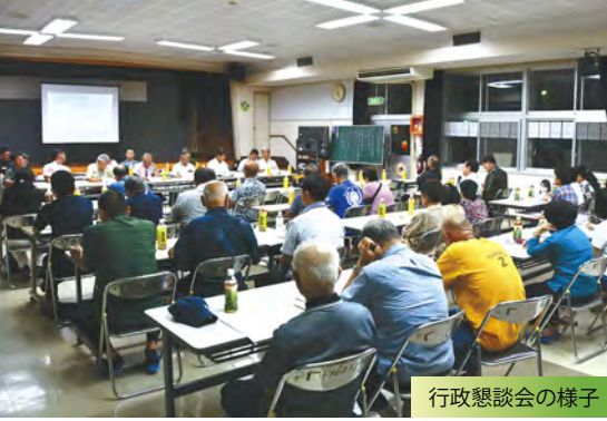
行政懇談会の様子