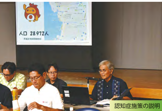
認知症施策の説明