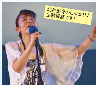
北谷出身のしゃかり♪ 生歌最高です!