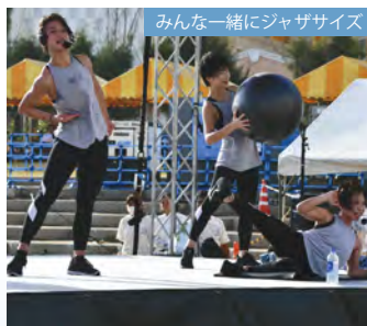
みんな一緒にジャササイズ