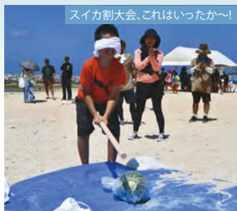
スイカ割大会、これはいったか〜!