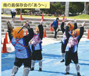
南の島保存会の「あう〜」