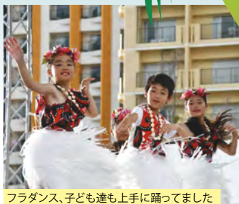
フラダンス、子ども達も上手に踊ってました