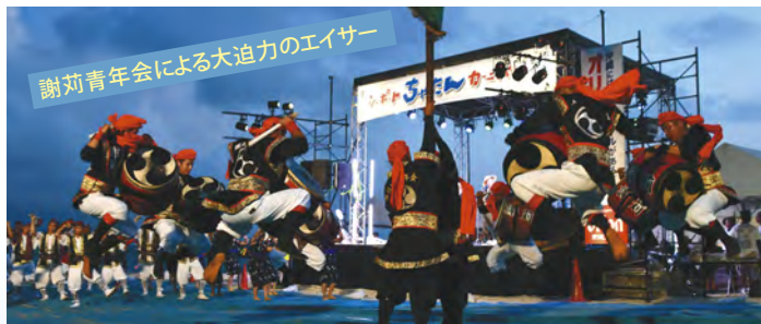
謝苺青年会による大迫力のエイサー