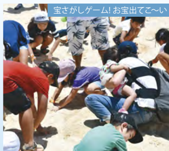
宝さがしゲーム! お宝出てこ〜い