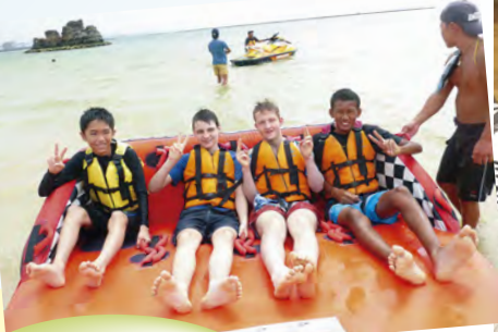
ホストファミリーと一緒にチューブ、スノーケルを楽しみました