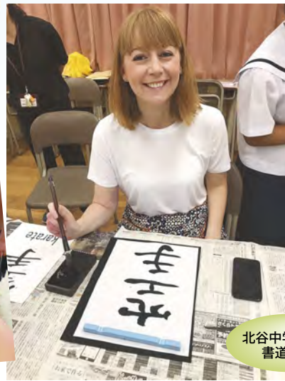
北谷中学校での書道体験