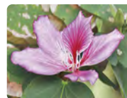
【町花】フイリソシンカ