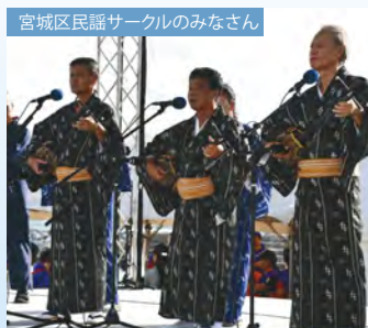
宮城区民謡サークルのみなさん