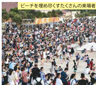
ビーチを埋め尽くすたくさんの来場者