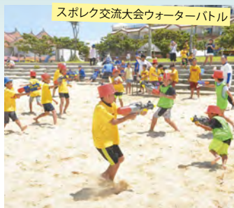
スポレク交流大会ウォーターバトル