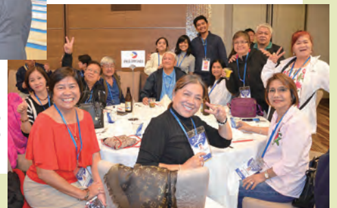
ビクトリーバンケットの様子(フィリピン代表の皆さん)