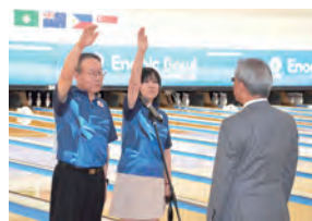
選手宣誓を行う日本代表の選手

平成30年12月9日(日)から17日(月)までエナジックボウル美浜で第15回アジアシニアボウリング選手権大会(公益財団法人全日本ボウリング協会主催)が開催されました。7日間に渡り4部門10種目で行われた今大会では、9か国・247名のアスリートボウラーが参加し、ボウリングをとおしてアジア各国の選手同士の友好・親善を深めました。大会期間中は、英語や中国語、韓国語など様々な言葉が飛び交い、アジア大会ならではの雰囲気でした。また、参加者たちは競技外でも美浜アメリカンビレッジをはじめとした本町の観光スポットを巡り、景色や料理を堪能していました。