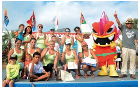
女子ハーリー優勝：ガナーズ