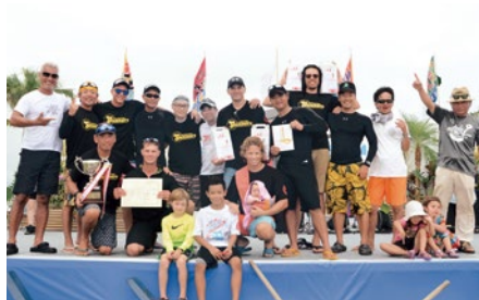
一般ハーリー優勝：ガナーズ