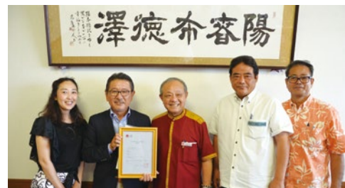
北谷の観光を盛り上げていきます!

6月5日(月)(一社)北谷ツーリズムデザイン・ラボが北谷町を表敬訪問し、観光庁の「日本版DMO」候補法人に登録された事を町長に報告しました。同社はデポアイランド通り会を母体に昨年7月設立され、5月12日「日本版DMO」候補法人として登録されました。同社は今後、北谷の観光マーケティング、調査や新たな魅力づくり、PR戦略等、北谷町や民間企業、地域住民と連携しながら、観光地北谷を盛り上げていきます。