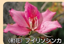
《町花》フィリピンシシカ