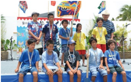
こどもハーリー優勝：浜川ハーリーズ

6月11日(日)晴天の下、第11回ニライハーリーが北谷町フィッシュヤリナ整備用地で行われました。ハーリー全部門で約60チームのエントリーがあり、各チーム強い向かい風に苦戦しながらゴールを目指しました。決勝戦では、800m(予選は400m)を全力で漕ぎ続け、手に汗握る白熱したレースとなりました。会場ではハーリー以外にも、魚のつかみ取り体験や西原高校マーチングバンド部のパフォーマンス等、様々なアトラクションで来場者を楽しませていました。懇親会も大盛り上がりで素晴らしかったです。