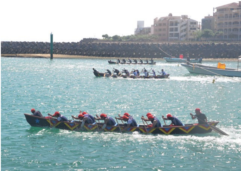
一般ハーリー決勝戦の様子

6月11日(日)晴天の下、第11回ニライハーリーが北谷町フィッシュヤリナ整備用地で行われました。ハーリー全部門で約60チームのエントリーがあり、各チーム強い向かい風に苦戦しながらゴールを目指しました。決勝戦では、800m(予選は400m)を全力で漕ぎ続け、手に汗握る白熱したレースとなりました。会場ではハーリー以外にも、魚のつかみ取り体験や西原高校マーチングバンド部のパフォーマンス等、様々なアトラクションで来場者を楽しませていました。懇親会も大盛り上がりで素晴らしかったです。