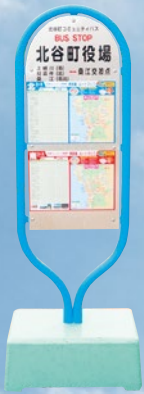
このバス停が目印です。

上勢頭・桃原・栄口・桑江・宮城・砂辺等中心に回る北コースと、謝苅・宇地原・北玉等を中心に回る南コースがあり、どちらも美浜周辺を経由するルートとなっています。料金は一般利用者200円、割引対象者は100円です。詳しくは、コミュニティバスのリーフレットや町ホームページをご参照ください。本格運行実現の為に、積極的なご利用をお願いします。