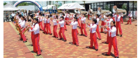
西原高校マーチングバンド部