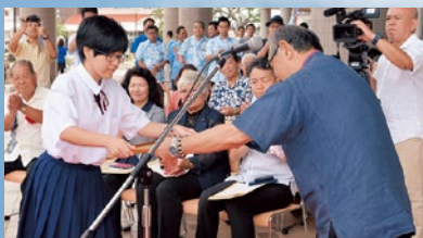
出発式にて表彰を受ける北谷高校生