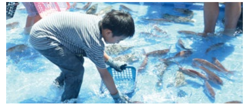
魚のつかみ取り体験