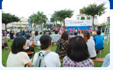
△昨年のアラハふれあいフェスタ(10月29日)

グラスボート体験 (北前区民対象)も実施 ステージ公演の前に、午後2時30分から、北前区の子ども・保護者・お年寄りを対象にグラスボート体験を実施します。(申込方法等詳細は北前区自治会から別途お知らせします。)