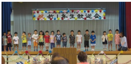
元気いっぱいの新一年生皆さん