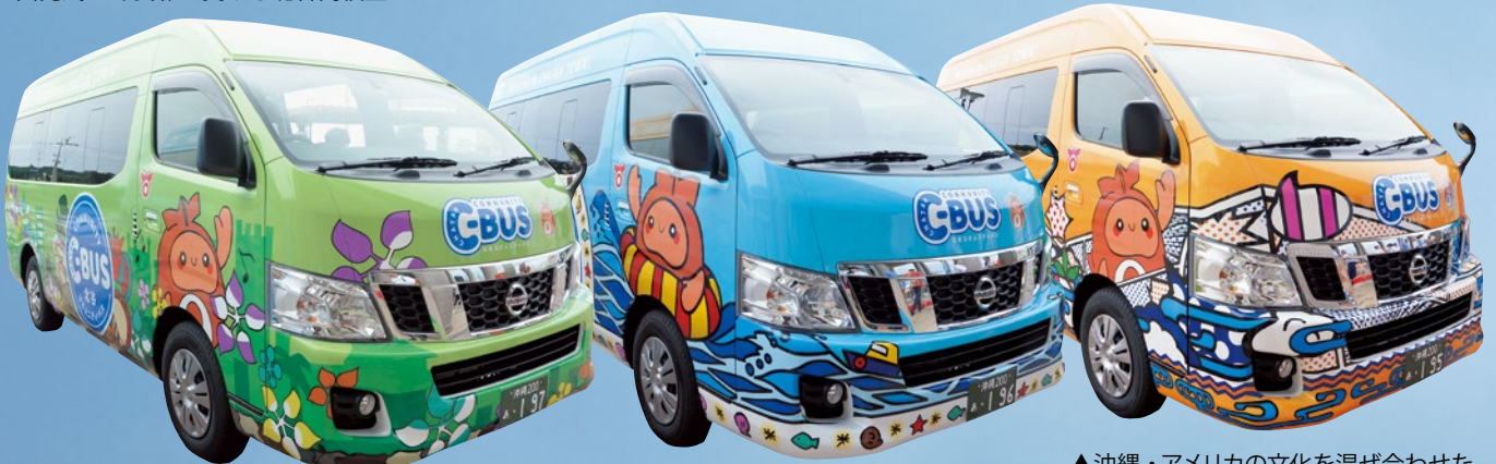
▲北谷の自然・街並み・文化をひと目で感じられるデザイン