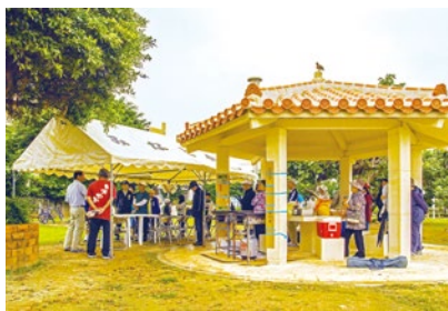
東屋完成を祝う様子