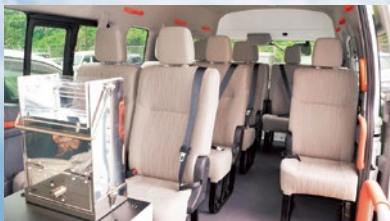
バスの中の様子(定員12名)