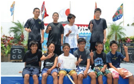
中学ハーリー：桑江ハーリーズ