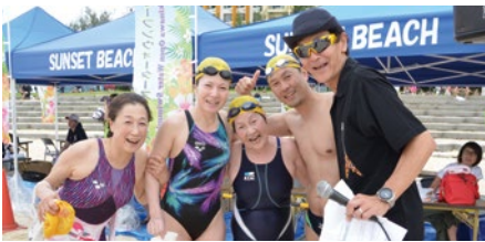
完泳した76歳の女性(写真中央)

6月3日(土)北谷サンセットビーチで第1回沖縄オープンウォータースイミングが行われました。県内外から総勢約160名の参加者が、1.5kmから10kmまでの各種目を泳ぎ、1.5kmの部では大会最年長76歳の方が完泳しました。オープンウォータースイミングとは自然の中で行われる水泳競技で、2008年北京オリンピックから夏季オリンピック正式競技となっています。