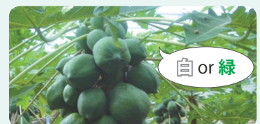
▲一般的なパパイヤ葉柄が白色又は緑色