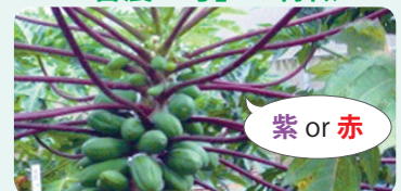
▲遺伝子組換えパパイヤ「台農5号」葉柄が紫又は赤色