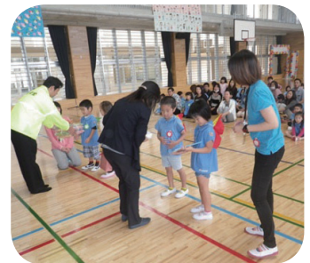
▲北谷町交通安全推進協議会から新入園児に対するハンドタオル贈呈の様子

平素から自動車利用者、自転車利用者、歩行者の皆様が交通ルールとマナーを守り、安全確認を十分に行い、交通事故のない安全で安心なまちづくりにご協力いただきますようお願い致します。