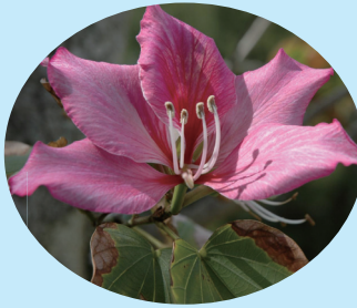
町花フイリソシンカ