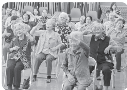
▲笑顔で「貯筋運動」に取り組む参加者の様子。

このプロジェクトは、月3回のちゃとれ運動指導員による運動教室のほか、福祉課、保健衛生課、琉球大学による健康に関する講演会などを企画しています。開所式の前後に行われた運動教室では、多くの区民が楽しみながら笑顔で「貯筋運動」に取り組みました。