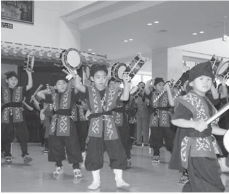
▲ニライまつりの最初を飾った上勢区子ども会によるエイサー

ほかに、もちつき大会や、お絵書きコンテスト、茶道体験、体力測定などの体験コーナーや、各種展示コーナーもあり、家族みんなで楽しめるイベントでした。