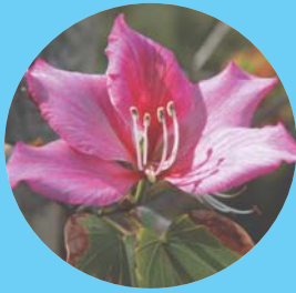
町花フイリソシンカ