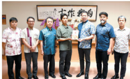
北谷町まちづくり研究会 様