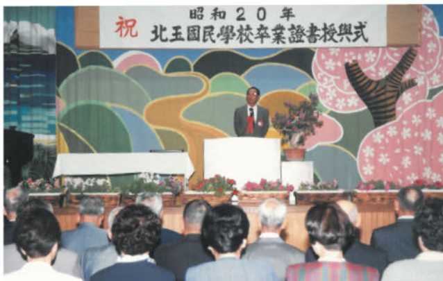
北玉国民学校卒業式(1996年)

1945年(昭和20年)3月、戦時中の沖縄では米軍の上陸が目前に迫り、県内各地の学校は機能を停止せざるを得ない状況にありました。そのため、北玉国民学校でも卒業式を執り行うことができず、昭和3年・4年・5年生まれの子供たちは、その日を迎えることなく激動の時代へと踏み出すことになりました。