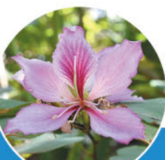
《町花》 フイリソシンカ