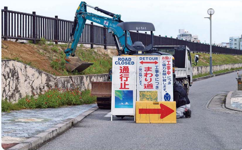
急げ！宮城海岸普及工事！！

答 繰越事業で平成31年4月26日付けで請負契約を締結しており、完了は令和元年7月31日。現在の進捗状況は、工事前の事前調査を終え、6月中旬の施工に向けて準備を