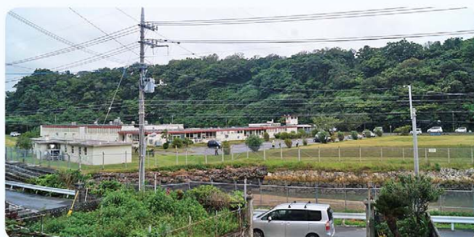
基地返還後の町の未来へ

答 道路などの幹線的な社会資本整備導入が期待できる地理的、環境的状况にないため補助事業採択基準が満たない「補助対象外」となることが予想される。土地区画整理事業の財源は保留地処分金のみとなるが、同用地の先行取得は、減歩率の軽減策につながる。