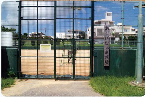
共用開始したあしびなあテニスコート