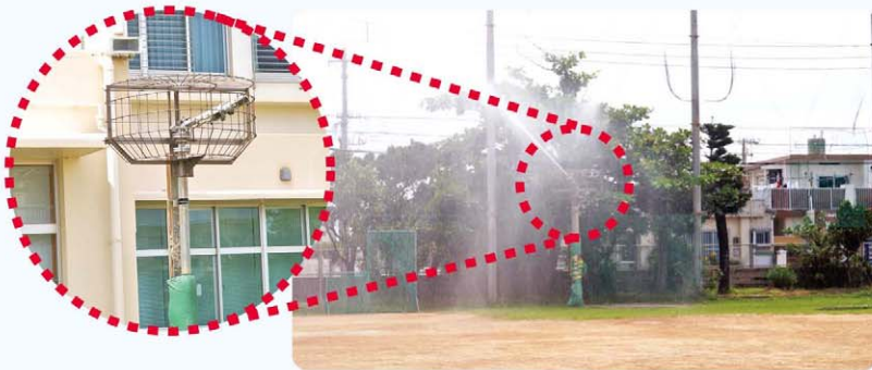
砂塵対策に有効な浜川小学校グラウンドのスプリンクラー

答 運動場表面のクレー舗装に樹木の樹皮を利用した改良剤の添加、トラック以外の主要部分の芝生化、既存暗渠の更新及び既存スプリンクラーのタイマー制御化を行い、砂塵対策能力と雨水の排水機能を向上させる改修工事済み。砂塵の発生が抑えられ、周辺住民の住環境は改善されている。