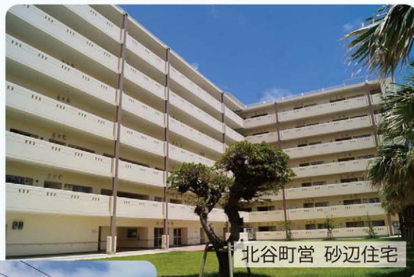
北谷町営 砂辺住宅

答 町営住宅の入居者は、一般75世帯。単身31世帯。高齢者10世帯。障がい者31世帯。県営住宅の入居者は、一般374世帯。単身39世帯。高齢者140世帯。障がい者66世帯。