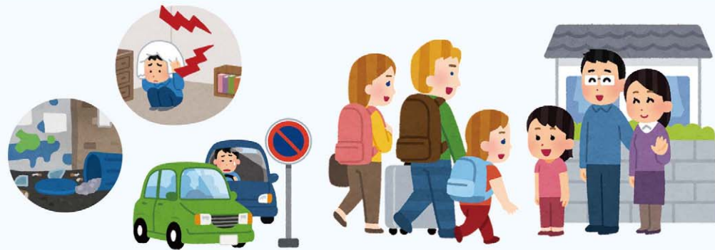
民泊施設周辺の生活環境の改善を