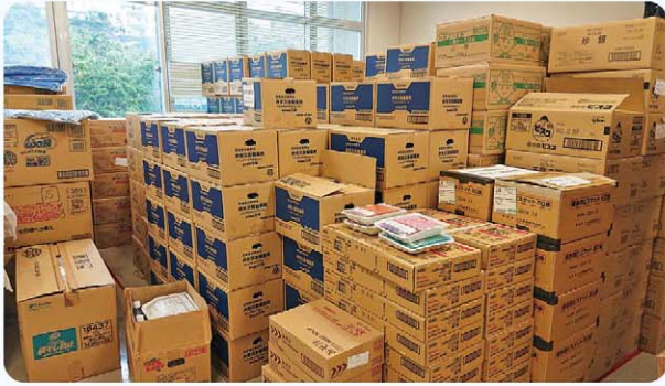
庁舎内の備蓄倉庫のようす

答 平成31年度新規事業の観光防災力強化市町村支援事業について、観光防災力を強化するために同補助金を活用し、本年度は非常用発電機10台、備蓄食2千200食、飲料水(500ml)2千200本、毛布300枚、災害用簡易トイレ4千500個の整備と、避難誘導看板設置のための場所の調査。