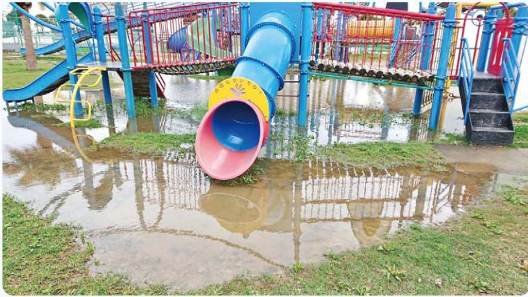
対応を望む！砂辺馬場公園遊具下の水たまり！