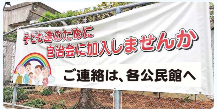
自治会に加入しましょう!

問 庁舎を日光から遮り省エネルギーを推進する緑のカーテンでおおわれることで室温が下がり、エアコン代の節約にもつながるが推進は