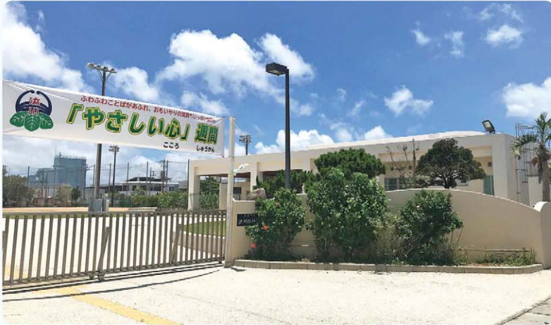
幼保無償化、スムーズな対応が望まれる

答 運営費として約3千260万円、給付費として約1千350万円、保育料収入の減額分が全額町の負担となり、約4千200万円、合計で約8千810万円の負担増となる見込み。過去3年間の町負担額は、平成28年度が約1億9千万円、平成29年度が約2億2千400万円、平成30年度が2億3千100万円。