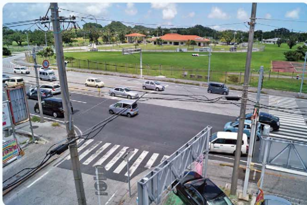
道路拡張、改良工事がまたれる交差点

答 今後は、道路拡張に伴う実施設計を予定。道路区域に含まれる防衛局管理の土地も、以前は町民農園のような無償貸付という話もあったが、防衛局との協議は、買取りになることが確認され、その手続も進める。