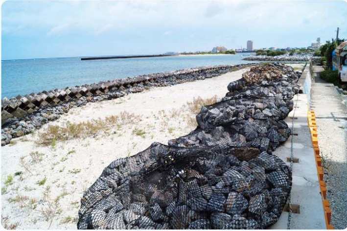
北前区民が待ち望む、冠水対策と道路整備

答 県の高潮対策事業の護岸整備工事と工程を合わす必要があり、沖縄県と連携を図りながら進める予定。北前安良波線の道路改良工事は、今年度、漁業補償及び道路整備に係る海岸部分の埋め立て申請