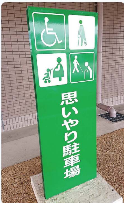
庁舎の設計テーマは「高齢者や身体に不自由な人に優しい建物」