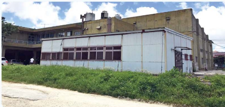
今後取り壊される加工所(商工会裏)

建物自体が大変危険な状態であり、現在は利用者の安全及び衛生面から、施設利用を制限している。当施設は、今後取り壊す方向で考えている。