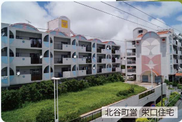
北谷町営 栄口住宅