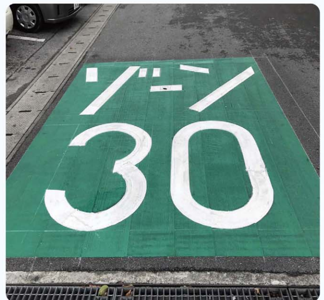
交通安全対策に有効なゾーン30