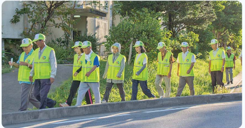
日々のパトロールが防犯対策のカギ

答 保護者、地域及び警察の協力のもと、実現できるものと考えている。地域住民の生命や生活を守るため関係機関や地域との防犯対策の充実を図り、関係団体との見守り体制