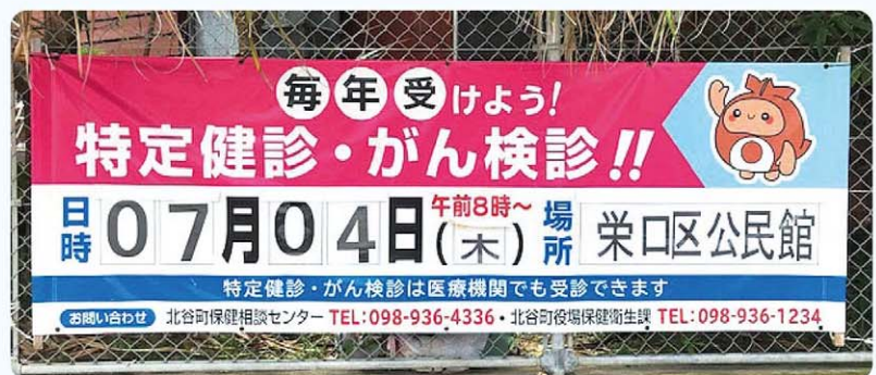
検査項目を増やし、病気の早期発見・予防に