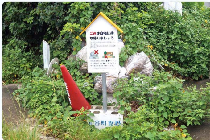
うぐいす谷墓地公園に放置されている大量のごみ

が不法投棄物の処分の責任を負う。担当課では、以前から当該土地所有者の所在確認を行っている、新たな不法投棄が増えないよう注意喚起の立て看板の設置やパトロールによる不法投棄防止対策に努めている。