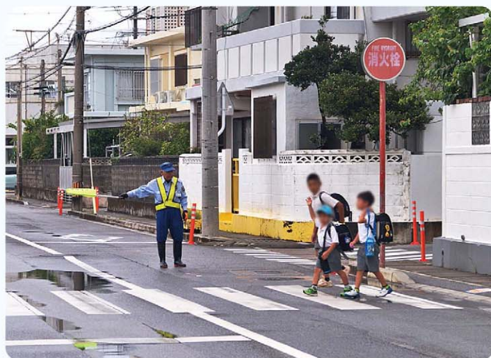
朝の交通安全指導を行う警備員

設置、見通しの悪い道路、歩道の設置等の要望・要請（県道・国道含む）の件数は 答 地域からの要望・要請について、平成26年度に5件、平成27年度に15件、平成28年度に1件、平成29年度に6件、平成30年度に5件で、合計32件。