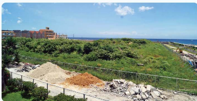
馬場公園と一体化した計画がなされる国有地

砂辺・宮城地区の住環境や景観に配慮し、本町唯一の自然海岸が残る砂辺の浜や馬場公園と一体化して公園機能が高まるような活用を図り、砂辺区民の憩いの場となるよう地域住民の皆様と意見交換を重ね、利用計画策定に取り組む。