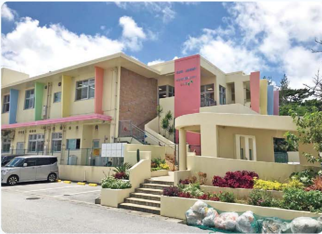
幼保無償化がはじまる。待機児童の解消も！

設等についても無償化の対象となる。5年間は経過措置、無償化給付対象施設として確認を受けた施設に対しては経過措置の期間中に保育の質を高め、指導監督基準を満たすよう、県と連携して指導する。