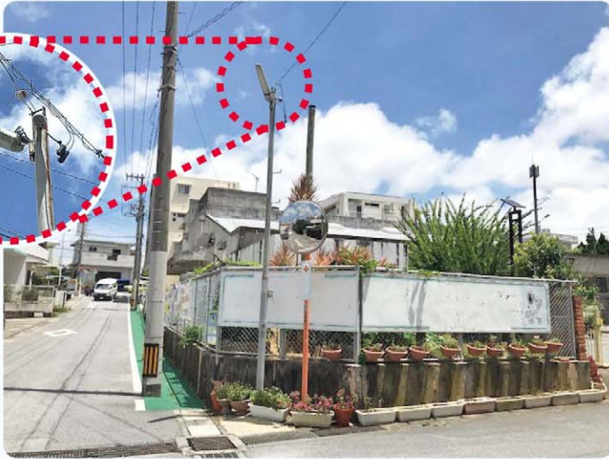
自治会が維持管理する保安灯

答 平成29年度、町域内に新たに55基の防犯灯を設置。そのほか、西海岸地域に青色防犯灯を設置し、現在、約40基が点灯。電気料金は、年間約90万円。自治会が維持管理する保安灯は、11行政区で平成30年度は1千399基。電気料金は、約210万円を補助。建て替えに要する補助を合わせると約430万円が昨年度の補助実績。道路照明灯は、町道における設置数497基、電気料金は、年間約1千700万円。