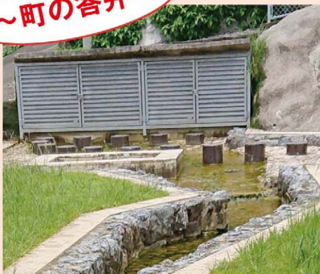
水質調査予定の宇地原公園内ホースガー