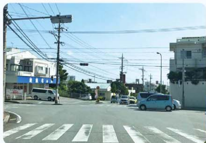
渋滞緩和のため、右折矢印信号の設置を望む

答 平成30年度は4事業所の協力を得ることで合計21の事業所が認定事業所となっており、8事業所が町内の事業所。