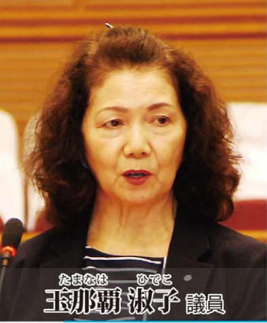
たまきは ひとこ 玉那覇 淑子 議員