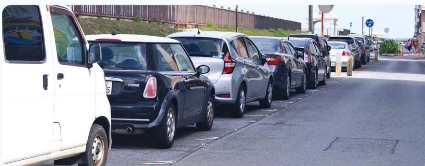
宮城海岸の無料駐車場を有料にできないか

答 無料駐車場は、大半がダイビングシヨップの車両が専有する状況が見受けられ、これまでも過去に、看板を設置して注意喚起を行った経緯があり、改善がみられないのが現状。駐車場の有料化は、他地域の事例等を参考にしながら調査研究していく。