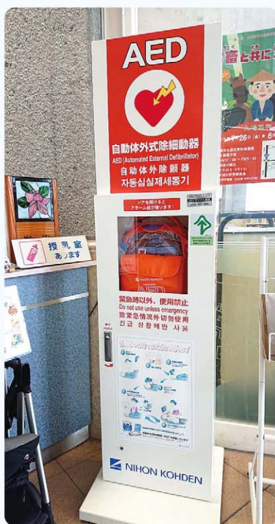
宮城・砂辺海岸へAEDの設置を!