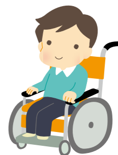
障がい者支援にかかる借用物品の拡充を！