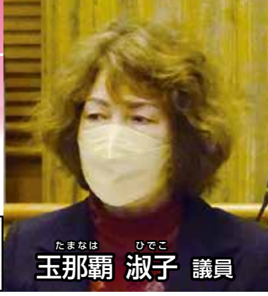
たまな ひとこ 玉那覇 淑子 議員