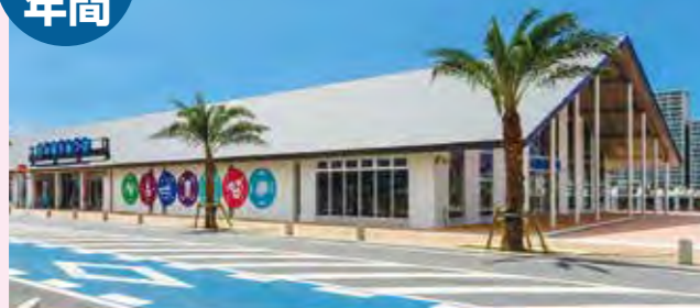
うみんちゅワーフ(通称)