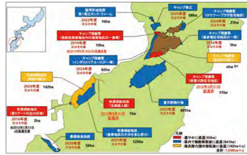
嘉手納飛行場以南の土地の返還(統合計画) 嘉手納飛行場以南における米軍再編の進捗状況について(平成27年5月29日防衛省)

問 返還計画と実現見込みは 答 本町内では4施設。「キャンプ瑞慶覧施設技術部地区内の倉庫地区の一部」は、令和2年3月に返還。令和4年度又はその後に「陸軍貯油施設第1桑江タンク・ファーム」、令和6年度又はその後に「キャンプ瑞慶覧インダストリアル・コリ