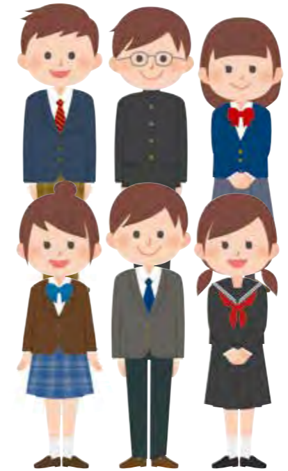
更なる制服の選択制の推進を！

の候補者の氏名をあげて、投票を依頼、あるいは投票をしないように依頼することが禁じられている。②は、公職選挙法にすべての公務員は、その地位を利用して選挙運動をしてはならない。③は、公職選挙法で地位を利用しての選挙運動の禁止が定められており、地方公務員法では政治的行為の制限、特に選挙に際して政治的行為を行うことが禁止。④は、戸別訪問は禁止、告示前においても投票依頼のための戸別訪問は禁止。⑤は、告示前の多数ののぼりは公職選挙法に反するものとなると思われる。また連呼行為も公職選挙法で一定の制限の下、選挙運動として行うことができ、告示前の同