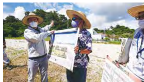
博物館建設予定地にて、担当課より詳細を説明

町立博物館の整備は、多くの町民が待ち望まれているものであり、町立博物館構想の段階から決定されてきたものであると認識。多くの町民の信任を受けて当選を果たし町立博物館建設についても民意を得られたものであると考えている。古代から脈々と続く北谷の歴史を子どもたちとともに体現できる夢あふれる博物館、戦後復興の現代史と合わせて後世に遺していくために町立博物館建設事業を推進し、北谷町の誇りとして繋げていく。