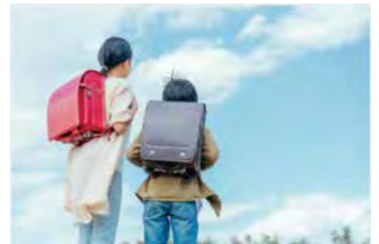
子どもの貧困対策の更なる支援を！

① 子どもの貧困対策支援員の配置 事業では、社会福祉士1名を配置し、各地域の実態把握、学校や居場所づくりを行うNPO等との連絡調整を行うとともに居場所の担い手の確保、新たな居場所づくりに取り組んだ。② 子供の居場所事業では、1箇所の運営と3か所の支援を実施。学習支援を通じた子どもの居場所(ちーたん)運