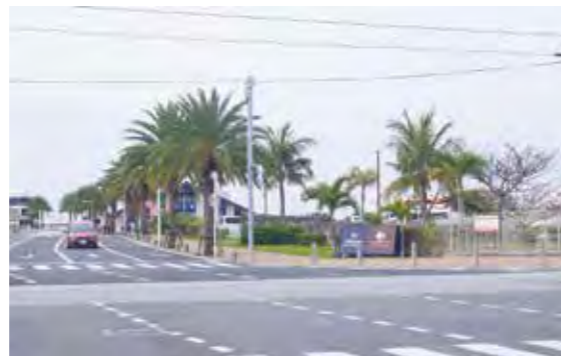
うみんちゅワーフの入口にシンボルマークを！

問 うみんちゅワーフ入口に、シンボルマークとして噴水を設置し、町民や観光客の癒しの場や憩いの場を提供してはどうか 答 民間活力を最大限に活用し、活性化を図るためのスペースで、そこに当該噴水を整備