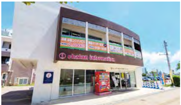
だれでも、いつでも、無料でPCR検査を！

営。食事の提供を目的とした居場所を2か所支援。基本的な生活指導を目的とした居場所を1か所支援。課題は北谷町子どもの貧困対策庁内連絡会議で確認された主に2点。①「ボランティアをコーディネートする機能の必要性」は、公費のみならず寄付金等を資源として、行政・民間・地域住民が協働して取り組む仕組みが求められる。本町では、行政・民間・地域住民の福祉活動を促進する役割を北谷町社会福祉協議会が担ってきたので、活動促進の働きかけが求められる。②「子どもの貧困対策の全庁的な取組の推進」は、これまでの6年間、行政・民間・地域の取組みにより、地域の様々な場所や人、団体による子どもの居場所づくりが芽を出してきた。今後、庁内各部署が本町総合計画に基づく地域との協働による視点で事業展開していく。