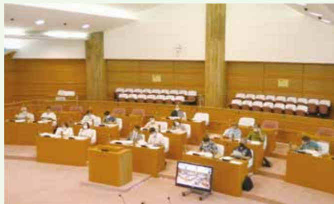
第519回 9月定例会 本議会の審議の様子(令和3年9月8日)

「北谷町総合計画条例」において、目的や定義、策定方針等が定められています。策定においては「適切な計画期間を設定し、地域の実情、社会経済情勢の変化等を踏まえ、これらに適合するように策定されなければならない」「町民の意見を十分に反映させるための必要な措置を講じた上で、町民との協働によって策定されなければならない」となっています。