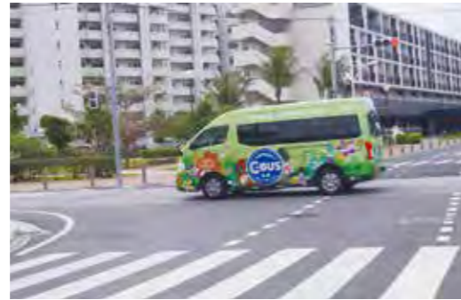
利用しやすいコミュニティバスを望む！！

問 コミュニティバス（Cーバス）が「路線バス」タイプから「区域運行」デマンド交通予約制になったが、町民から、なかなか予約が取れない等の声がある。今後の対応は 答 利用者アンケート調査では、予約方法について85%が「満足」「やや満足」という結果。新たな利用者の拡充に向けて調査や改善を重ねていく。