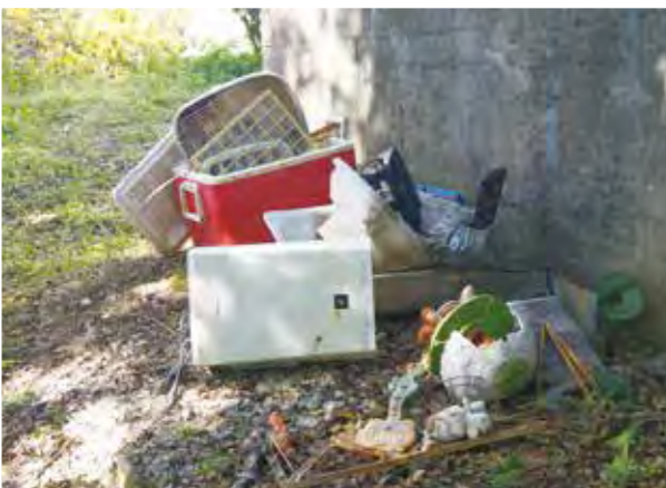
不法投棄は犯罪です

問 不法投棄の防止には、各地域のクリーン指導員の活動が重要と考えるが、活動が十分成し得る定数となっているのか 答 令和2年度が162件、令和3年4月から12月10日までの間が107件。現在、処理中の件、警告文の添付や不法投棄防止の看板を設置。