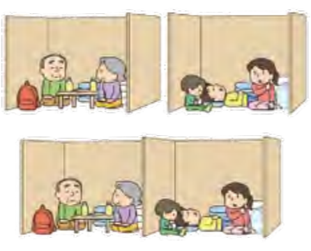
仕切りのある避難所

問 災害発生時の避難対象者に自宅療養者が含まれる場合の対応は 答 本町は、避難者の健康状態に応じた避難所のみ分けを行っており、「健康状態が良好な方」の避難所はちやたん二