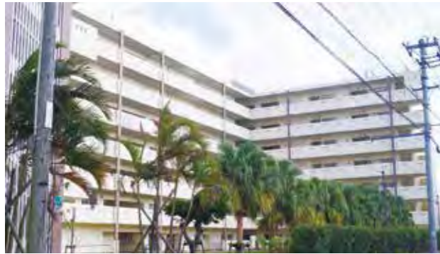
連帯保証人がいないように条例整備を