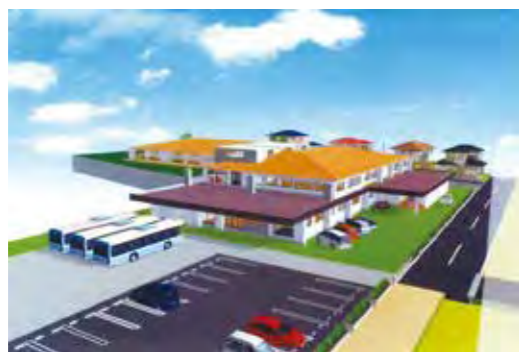
現在も未策定！管理運営計画書の早急な説明を！

問 管理運営計画書等の説明がなされていない必要性を問う。また、出来上がりはいつか、事業への影響は