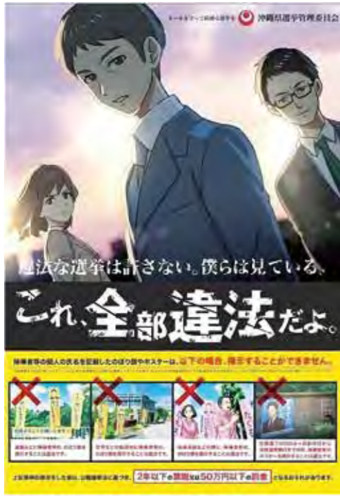
違法な選挙は許さない！ルールを守って綺麗な選挙を！

問 下記項目①町長の公務時間内の戸別訪問②町長の指名入札について業者へ言及③職員への選挙への関与④告示前の町長と候補者との会社や家への戸別訪問⑤告示前の多数ののぼりや連呼行為を含む街宣運動⑥街宣車の台数⑦町長の選挙への役職等での関与、の行為は選挙違反か否か 答 ①は、公職選挙法においていかなる者も、選挙人の住居や会社等に戸別で訪れ、特定