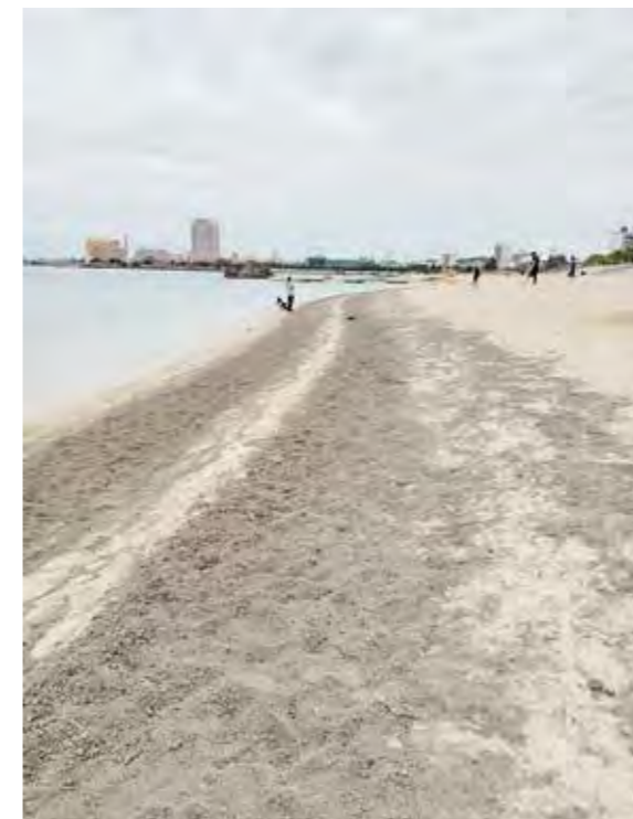
アラハビーチにも軽石が

問 町内にのこされた戦跡保存整備状況について 答 町内戦跡地等の保存整備は、関係機関と連携し、適切な保存と活用。「北谷町の戦跡・記念碑」発刊誌の中で紹介しており、「嘉手納基地内にある「嘉手納監視哨跡」や「ウカマジーの海軍砲台跡」白比川沿い「特攻艇秘匿壕」これらの戦跡等は、北谷町平和祈念祭における戦跡遺構巡りや学習教材となるコンテンツ資料として触れる機会を創出。町に現存する貴重な戦跡等は、戦争を風化させることなく、戦争の史実を次世代に正しく継承す