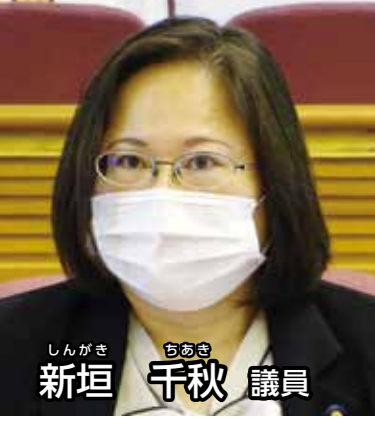
しんがき ちかこ 新垣 千秋 議員