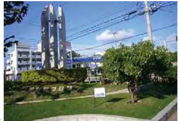
1986年ニライセンターに建設された「非核宣言の塔」と植樹された「被爆クスの木2世」

問 町内にのこされた戦跡保存整備状況について 答 町内戦跡地等の保存整備は、関係機関と連携し、適切な保存と活用。「北谷町の戦跡・記念碑」発刊誌の中で紹介しており、「嘉手納基地内にある「嘉手納監視哨跡」や「ウカマジーの海軍砲台跡」白比川沿い「特攻艇秘匿壕」これらの戦跡等は、北谷町平和祈念祭における戦跡遺構巡りや学習教材となるコンテンツ資料として触れる機会を創出。町に現存する貴重な戦跡等は、戦争を風化させることなく、戦争の史実を次世代に正しく継承す