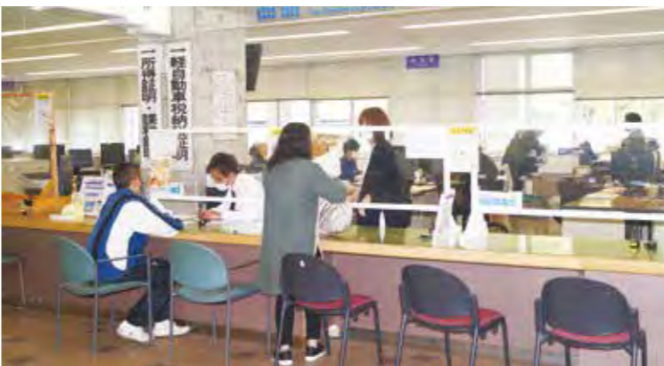
若者の世帯が喜ぶ臨時特別給付金開始！

問 3回目のワクチンの接種対象、接種時期、接種間隔、場所、ワクチンの種類の選択、順番、予約の混雑対策を問う 答 新型コロナウイルスワクチン接種を初回接種（1・2回目接種）し、初回接種から8か月以上が経過した18歳以上の方が接種対象者となる。病院及び有床診療所の入院患者は、初回接種の完了から6か月以上の間隔で追加接種を実施できる。65歳以上の高齢者も、令和4年2月以降から、初回接種完了から7か月以上