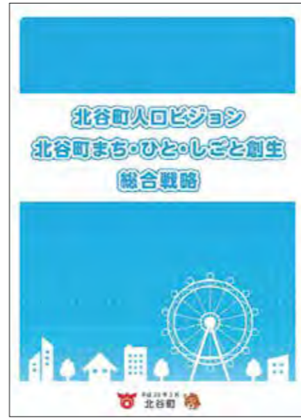
第六次北谷町総合戦略！

を超過した方へ追加接種を実施できるワクチンの種類の選択はファイザー社製又はモデルナ社製のmRNA（メッセンジャー）