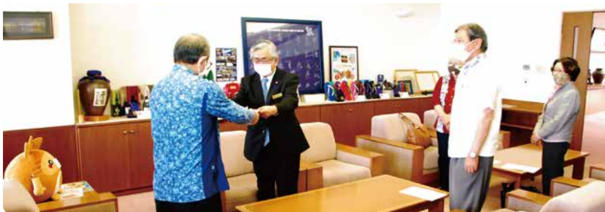
野国町長へ亀谷議長より提出した