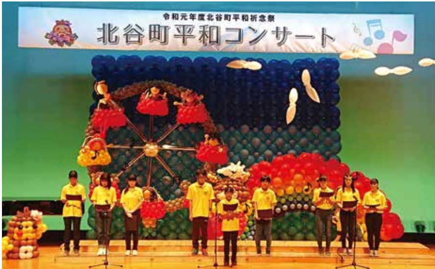
平和の心を伝えよう「北谷町平和コンサート」

答 「北谷町平和祈念祭」の中で、平和学習派遣者の報告会を予定。今年度については、沖縄戦の学習に重きを置き、戦後75年という節目の年に、戦争の実相を正しく継承するための事業を進める。年明けの2月頃に、広島・長崎への派遣学習を計画。