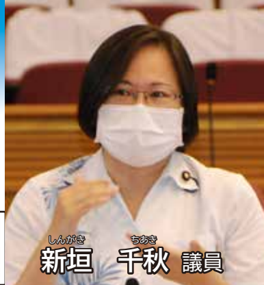
しんがき ちかこ 新垣 千秋 議員