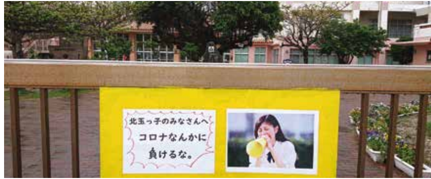
新型コロナなんかに負けるな

問 町民が活用できる県・国の支援策、本町独自の支援策は。また、町役場にて総合窓口を設置しているがどのような相談ができるのか 答 国は、全ての国民に一人一律10万円の給付する制度や子育て世帯を対象とした子育て世帯