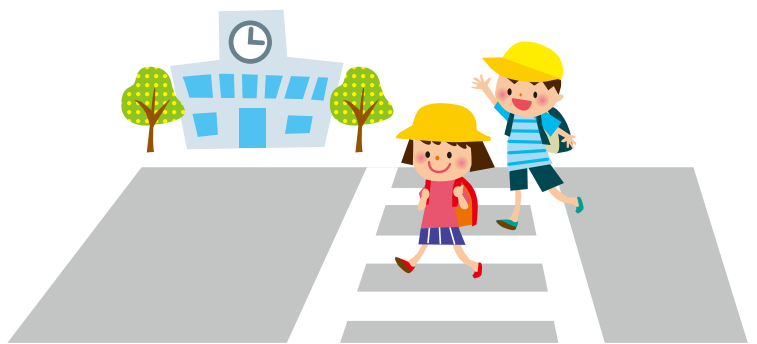
夏の登下校は帽子着用を推奨

問 他自治体ではボランティアによる炊出し(弁当の配食)も見られたが、町内のボランティア活動に公共施設の借用などは可能か 答 施設管理者が必要と判断した場合には、炊き出し等のボランティア活動の実施場所として公共施設を活用することは可能。