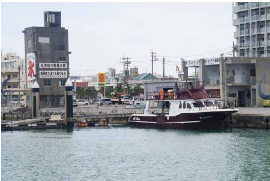
漁業者の経営継続補助金の時期は。