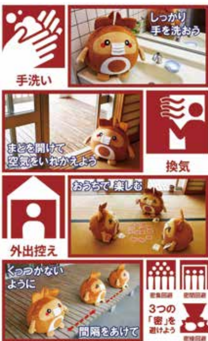
みんなができる感染症予防