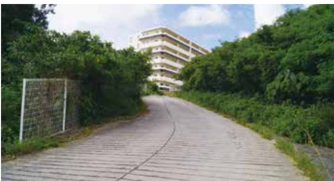
新北谷消防署周辺の避難経路

答 防災拠点の南側においては、北谷消防署の新築移転が予定されていることから、避難者が車両を利用した場合、消防・救助活動等の災害対応に著しく支障をきたすことが想定され、徒歩による避難に限定した活用になるものと考えている。