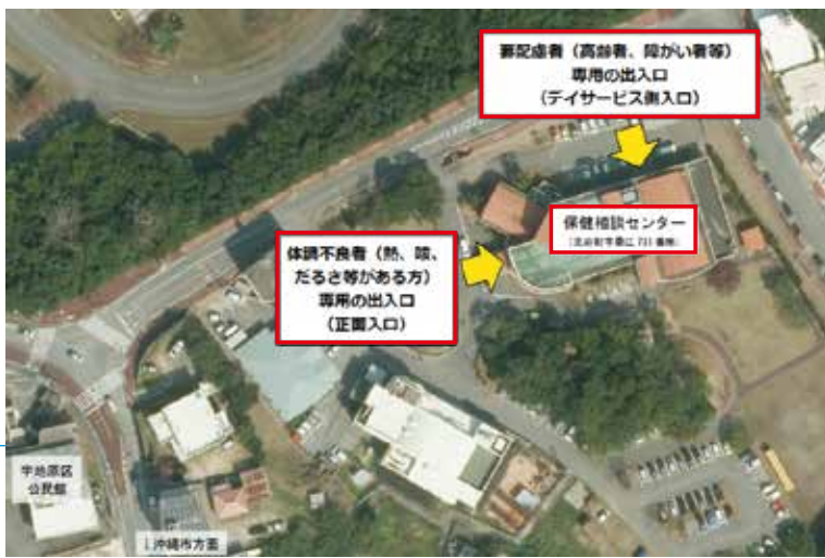
要配慮者や体調不良者の避難所は保健相談センター

答 内閣府が示す感染症対策を踏まえ、避難者の健康状態に応じた避難所の棲み分けをしており、感染症対策の取組みを徹底し避難者の安心・安全の確保に努める。また、親戚・知人宅に避難することも促進している。