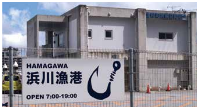
さらなる漁獲量を増やす取組みは

事業による優良漁具購入補助などを複合的に実施。今後は「獲る漁業」から「つくり育てる漁業」への転換、直販事業、水産加工業への参入推進を図るべく、北谷町漁業協同組合との協議を重ねながら、適宜調査検討。