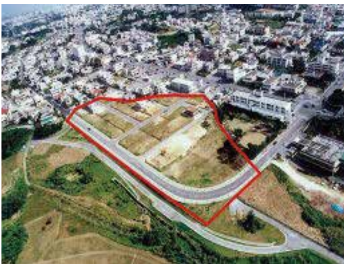
上勢頭第2土地区画整理事業（共同施行）（北谷町ホームページより）

答 国へ要請した本物件に係る措置要請に基づき、これまで沖縄防衛局は積極的かつ慎重に調査・分析・住民説明会の開催を実施してきた。その措置の1つとして、本件関係地権者・住民からの不安の声を聞き取り、その不安払拭措置として提案が沖縄防衛局から本町にあった。同提案では町による買取が前提となる措置となっており、民間との連携提案は無い。