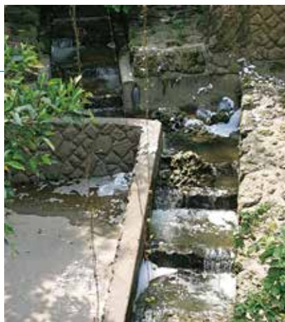
深酷なPFASを含む泡消火剤汚染（宜野湾市の公園）

答 沖縄県企業局は、設定された目標値を遵守し、県民の健康にかかる不安を払拭するため、さらなるPFOS等濃度の低減化を引続き検討していくとのこと。