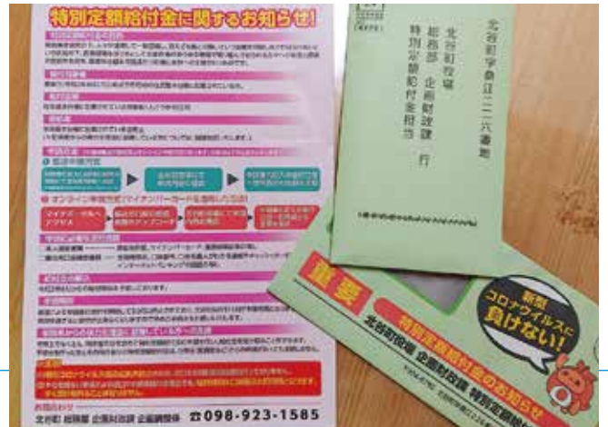
特別定額給付金の申請は8月11日まで！

問 DVに絡む給付手続等の対応状況は 答 随時受付し遅滞なく実施。郵送や窓口にて申請書を受け渡しする等、個々に応じ極力負担が生じないよう配慮。 問 生活保護申請件数と世帯数の月別件数は 答 昨年1月から12月までの申請件数が85件、月平均約7件。本年1月から5月まで申請件数は47件、月平均約9件。世帯数は概ね300件弱で推移。