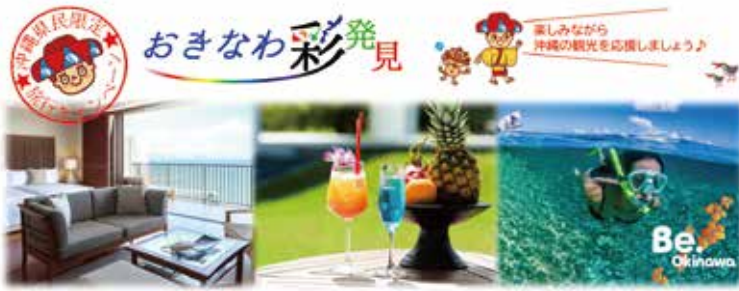
沖縄県ホームページより

答 本町においては、既存備蓄品の適正管理に努めながら、多種多様な備蓄品の中から必要な品、必要な数を検討のうえ、毎年度、備蓄品を追加購入し充足に努めている。今年度は、新型コロナウイルス感染症対策を踏まえた備蓄品の整備を図っているが、今後は、備蓄品に関する調査研究に努め、さらなる備蓄品の充実を図っていく。