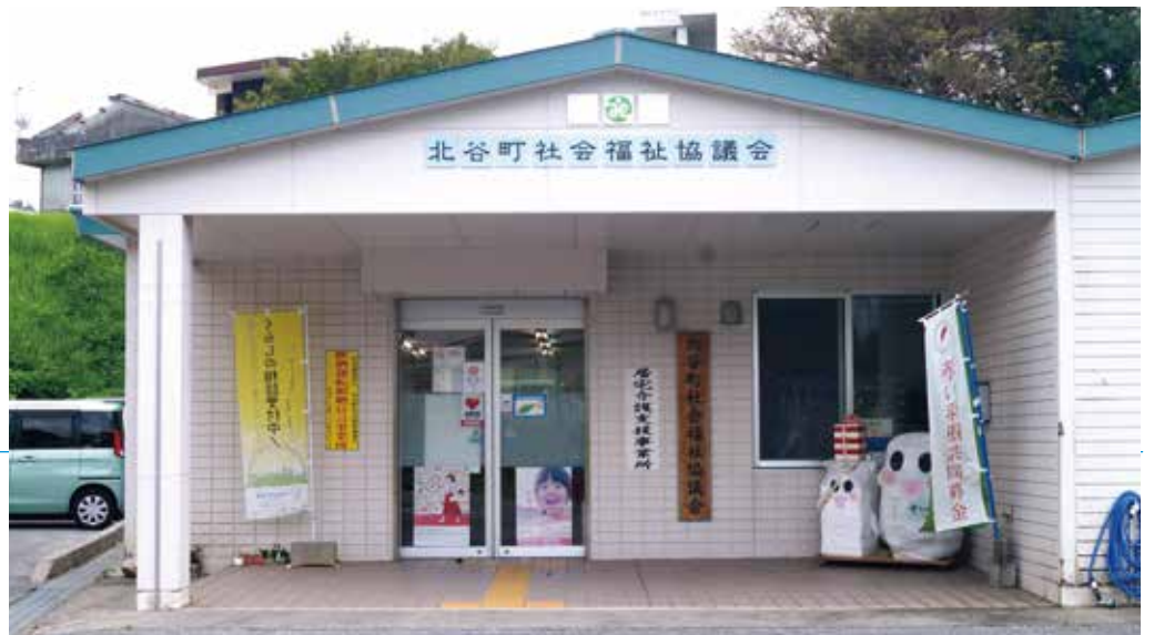
生活福祉資金の相談は社会福祉協議会へ

広く使える「持続化給付金」また、休業等を実施し、休業手当等を支払う等した事業主に対して助成する雇用調整助成金「国の第2次補正予算で創設された、家賃支援給付金や新型コロナウイルス感染症対応休業支援金等。県の制度は、飲食店を対象に支給する「新型コロナウイルス感染症防止対策緊急支援金（飲食店）」また、全期間休業に応じた事業者へ支給する「新型コロナウイルス感染症拡大防止協力金」。これら、国・県の制度に関して町民の申請がどれだけあったかは、申請窓口が本町ではない