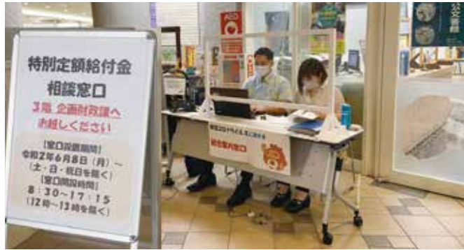
設置された庁舎内の総合案内窓口

問 コロナ支援策の周知の状況は 答 主に町ホームページや町広報誌に掲載して周知を図り、庁舎内に窓口を設置し案内をしている。