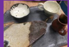
はじめての方優先