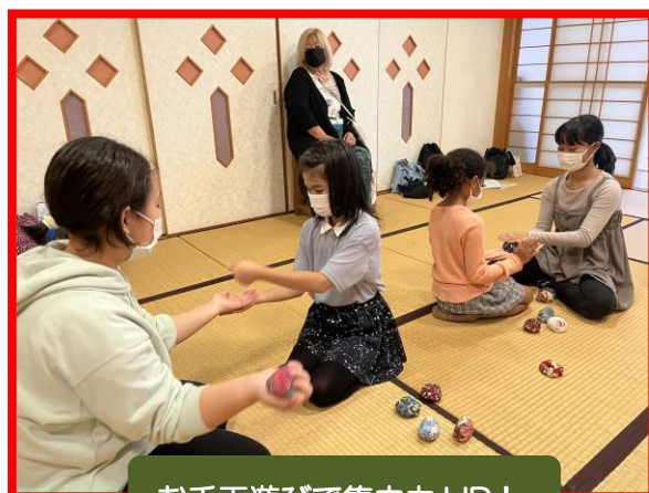
お手玉遊びで集中力UP!