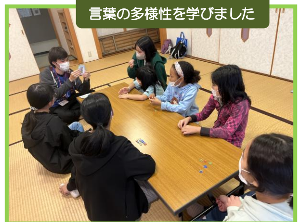
言葉の多様性を学びました