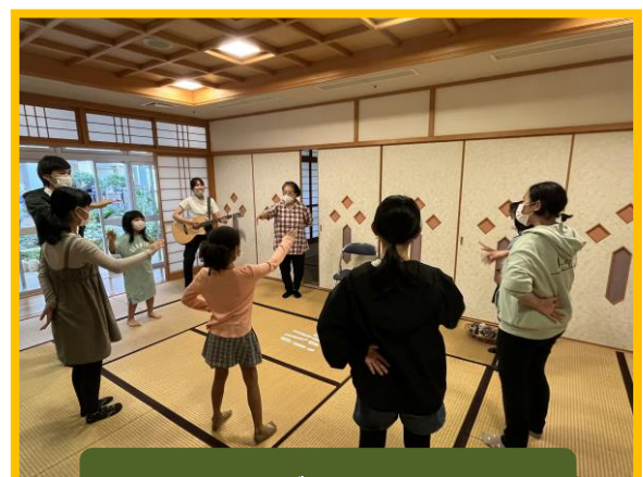
しまくとぅばやわったーDNA