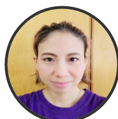
めどるま ちあり せんせい