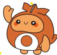
北谷町イメージキャラクター ちーたん