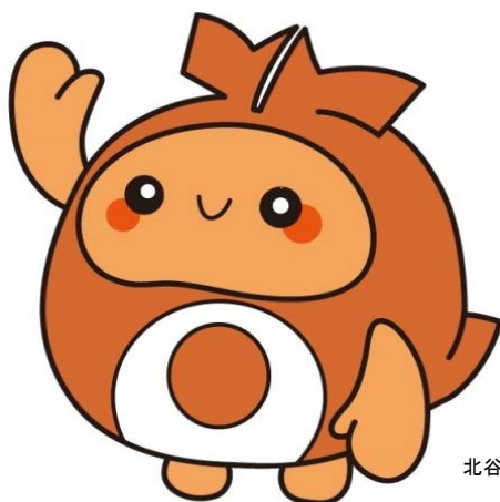
北谷町イメージキャラクター ちーたん