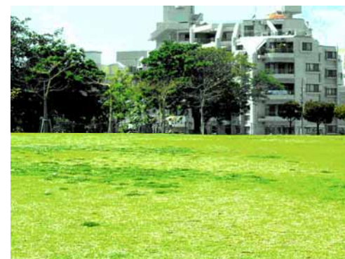
原っぱのイメージ