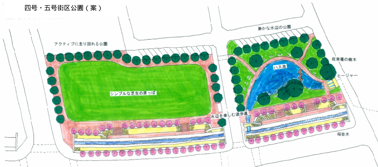
4・5号街区公園 平面図