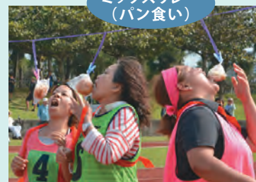
ミックスリレー (パン食い)

お問い合わせ 第39回北谷町民運動会実行委員会事務局 ☎982-7707 Fax 936-3491