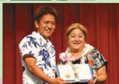
↑アロハパーティーにて感謝状を受け取る仲尾町青年連合会長

9月1日から2日にかけて、アメリカ合衆国ハワイ州にあるハワイコンベンションセンターで第36回オキナワフェスティバルが開催され、北谷町から派遣された北谷町青年連合会がエイサーを披露しました。オキナワフェスティバルは、ハワイへ移住した沖縄県出身者の子孫がハワイでも自分たちの祖先の文化を伝えていかなければならないという思いから開催されました。会場では沖縄の芸能の披露や県産品の販売等があり、約2万5千人の来場者が沖縄の文化や食を堪能し