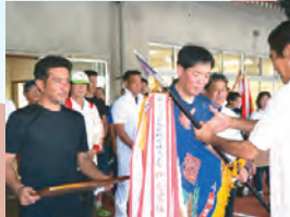
←北谷町総合体育大会 優勝旗授与の様子(桑江区)