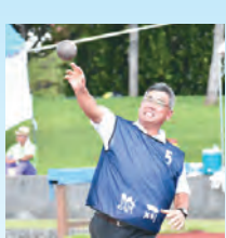
→50代男砲丸投の様子

谷町総合体育大会の最終種目ということもあり、総合優勝を狙って熾烈(しれつ)な戦いを繰り広げました。参加者の皆さま、お疲れ様でした。