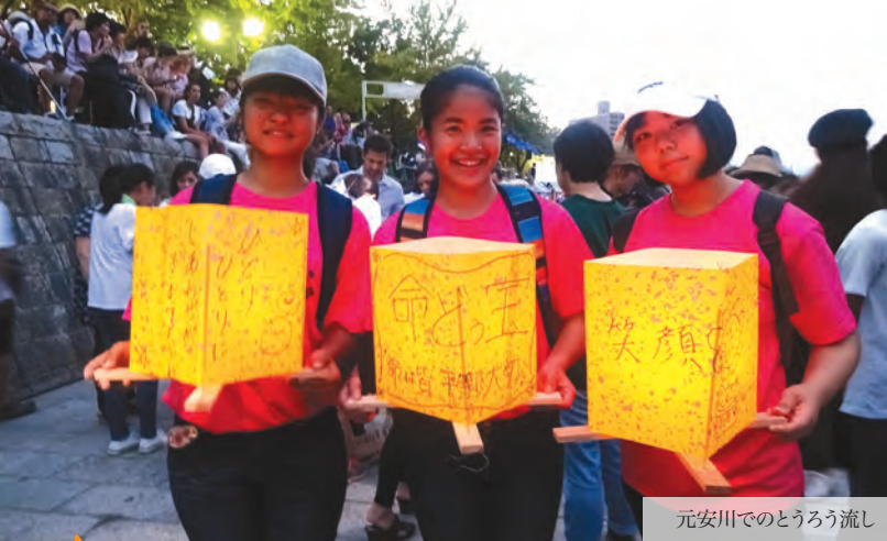
元安川でのとうろう流し

北谷町では、沖縄戦体験および広島・長崎の被爆体験を学習することにより、戦争の実相を正しく把握し、平和の尊さ・命の大切さを次世代に引き継ぎ、恒久平和意識の高揚および平和な社会を築き上げていく人材の育成を図ることを目的に、町内の中高生を広島県・長崎県へ派遣しています。平成7年度から今年度までに131名の皆さんが派遣されています。