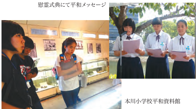
本川小学校平和資料館