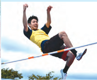
一般男子走高跳の様子↑