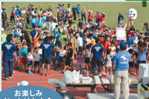
お楽しみ じゃんけん大会