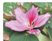
【町花】フイリソシンカ