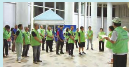
夜間街頭指導開始前の様子