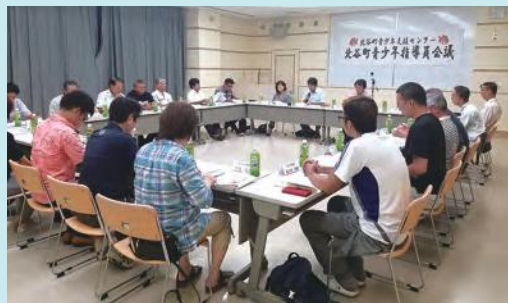
第1回北谷町青少年指導員会議

7月11日(水) 町役場にて第1回北谷町青少年指導員会議が開催され、前年度の活動報告や平成30年度の活動内容、課題などを話し合いました。北谷町青少年指導員とは、教育長から委嘱を受けた本町の青少年指導及び健全育成の業務に従事する指導員のことです。定期的に夜間街頭指導などを行い、施設内外にて児童生徒や保護者へ声をかけながら、事故やトラブルに巻き込まれないように帰宅を促すなど、指導員同士や各学校、PTAと連携を取りながら日々積極的に活動しています。