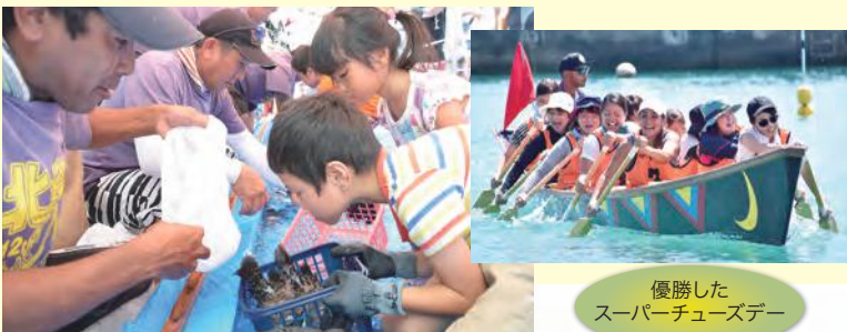
優勝した スーパーチユーズデー

7月に台風接近のため延期となっていた第12回北谷ニライハーリー(北谷町漁業協同組合ハリー実行委員会主催)が、8月3日(金)に浜川漁港に場所を移して開催されました。当日は、突き刺さるような強い日差しの中、すべてのチームが最後まで漕ぎ切りました。また、恒例の「お魚つかみ取り」や懇親会の「カラオケ大会」など来場者が参加できるイベントも多く、ほのぼのとした雰囲気の楽しいハーリー大会でした。