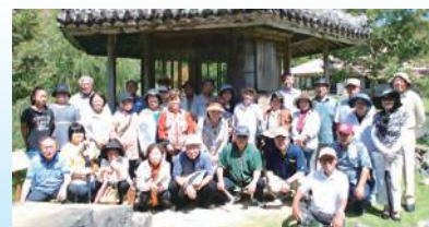
識名園を訪れた参加者