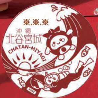
ちーたん入り風景印(北谷宮城郵便局配備)