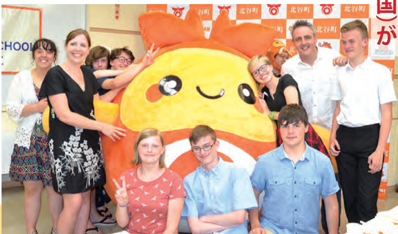
ディーンマグナススクールの皆さん