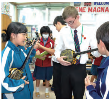
二線を習っている様子(桑江中)

の家族の様に一緒に過ごせたことにより絆が深まった」「英語スピーチコンテストで頑張つて英国派遣に選ばれたい」などの感想がありました。