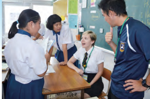
英語の授業の様子 (桑江中)

滞在期間中は、台風第7号が本島地方に接近するなど、生憎の天気ではありませんでしたが、ホストファミリーの配慮によりそれぞれの家庭で充実した時間を過ごすことができたようです。生徒たちからは、「本当の家族の様に一緒に過ごせたことにより絆が深まった」「英語スピーチコンテストで頑張つて英国派遣に選ばれたい」などの感想がありました。