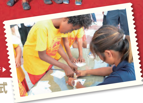
海中ポスト記念スタンプ押印の様子▶