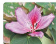
【町花】フリリソシンカ