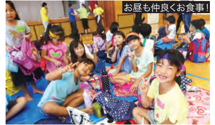
お昼も仲良くお食事!

5月26日(土)浜川小学校体育館にて上勢桑江・宮城・北玉の町内3児童館交流会が行われ、100名余りの子どもたちが参加しました。準備体操のダンスから始まった交流会は、館対抗ドッジビーや交流レクゲームなど各プログラムで大盛り上がりでした。館対抗のドッジビーの試合では、低学年の参加が多かった宮城児童館の子どもたちが他の館から助っ人を借りて何とか1勝することができ、1年生2、3名が泣いて喜んでいました。体調不良を訴える子もなく、みんな笑顔いっぱい交流会を終えました。