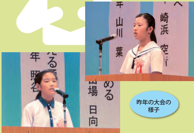
昨年の大会の様子