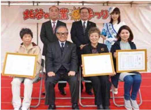
産業総合展示会受賞者の皆さん