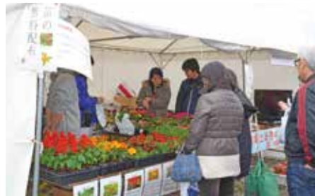
大好評!苗の無料配布