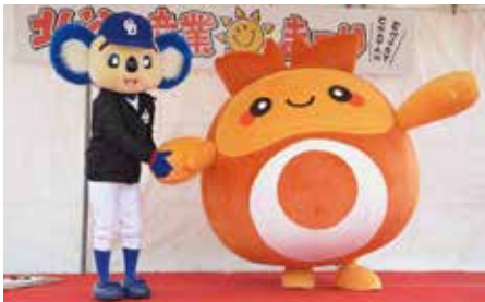
ちーたん&ドアラのコラボレーション