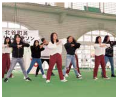
北谷高校ダンス部の皆さん