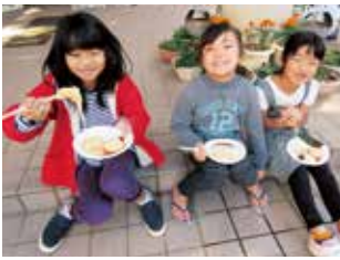
おいしいもちいただきます

1月14日(日)区民の親睦と健康増進を図り、自治会、総合スポーツクラブ、上勢子ども会共催の新年恒例『新春ウォークラリー&もちつき大会』が行われました。今年は登り下りのある約2キロのコースで、9問のクイズを解きながらゴールを目指しました。 ウォークラリーの後は、もちつき大会です！慣れない手つきで小さい子も、おじいちゃんおばあちゃんと一緒にもちつきを楽しみ、つきたてでアツアツのもちを、口いっぱい頬張りながら、和氣あいあいと過ごすことができました。