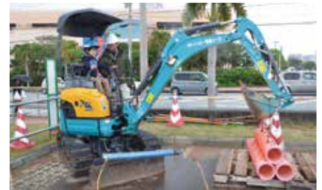
みんな大好き建築機械体験