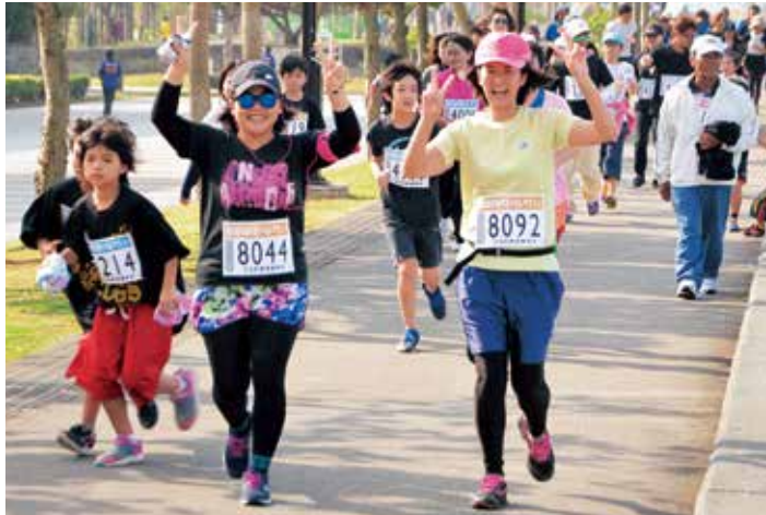
ダブルピースの仲よしコンビ