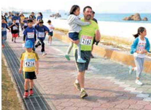
お父さんファイト!!