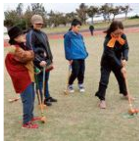
真剣にプレーする参加者

12月17日(日)美浜区自治会では、区民の交流を目的としたグランドゴルフ大会を北谷公園陸上競技場で開催しました。小学生から高齢者まで、およそ50人の区民が参加しました。ベテランチーム同士の熱戦や、初心者チームの和やかプレーなど、見ごたえやりのごたえのある楽しい大会でした。初めての参加者が慣れない手つきで玉を打つ様子に「もつと、こうするといいよ」と老人会の方が優しくアドバイス。世代を超えて親睦を深めていました。 美浜区広報通信員 宮原ゆかり