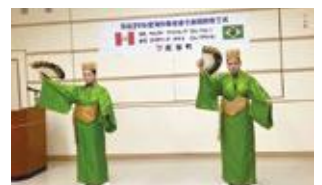
かぎやで風も立派に踊れました!