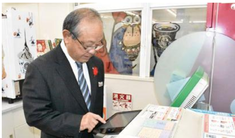
18日には野国町長も当サービスで住民票を取得しました。

住民課 住民係 コンビニ交付担当 ☎ 936-1234 (内線 215・214・213)