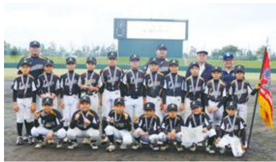
優勝した嘉手納ライオンズの皆さん

12月2日(土)・3日(日)一般財団法人北谷地域振興センター主催の第2回北谷町長旗(第7回北谷地域振興センター杯)少年野球大会が北谷公園野球場・ソフトボール場・砂辺馬場公園ソフトボール場