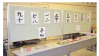
書道も上達しました。