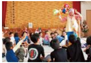
パフォーマンスに夢中な子どもたち

12月10日(日)北前公民館にて、北前未来クラブ(学推協)によるクリスマス会が開催され、子どもたちや保護者など約70名の参加者で賑わいました。舞台では、「クラウンあいろ」が風船パフォーマンスを披露し、風船で作ったアニメキャラを子どもたちにプレゼントしました。また、参加者による風船作り体験も行われ、楽しい時間を過ごしました。 みんなでケーキを味わった後は抽選会も行われ、一足早いクリスマスは大はしゃぎの子どもたちでした。 北前区自治会