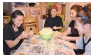
専攻研修の様子(美咲食堂)