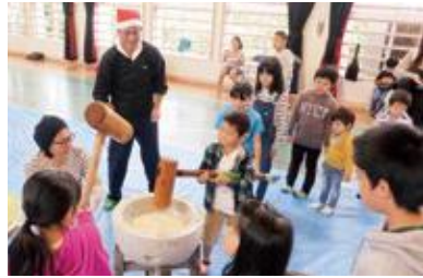
早くおもちがたべたいなあ〜

12月23日(土)学推協主催のもちつき会とクリスマス会が開催され、70名あまりの子どもたちが参加しました。子どもたちはなかなか見ることのないもちつきに興味津々で、つきたてのおもちは柔らかく、みんなで食べるとよりおいしく感じました。 若松会(桑江区老人クラブ)による輪投げゲームも大盛況!最後のプレゼントもあり、お年寄りから子供たちまで参加し、楽しい交流会になりました。 桑江区自治会