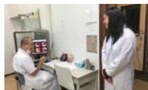
専攻研修の様子(成人病検診センター)