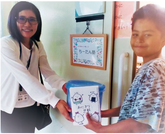
●お問い合わせ 子ども家庭課 子育て支援係 ☎936-1234

今後も、継続して取り組むことで子どもたちの成長を見守りながら、地域における世代間の関係づくりを目指しているそうです。