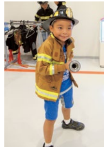
将来は消防士かな～?

7月28日(金)桃原区民の皆さん23名で沖繩市防災研修センターを訪れ、防災に対する知識を学びました。研修では、地震体験学習と消火訓練があり、いつ災害が起きても冷静に行動できる様にと、皆さん真剣に聞き入っていました。夏休みということもあり、多くの子どもたちが防災について考える良い機会になりました。桃原区では、今年度自主防災を立ち上げ、これからも継続して区民の皆さんと一緒に防災について考えていきます。 桃原区広報通信委員 知花 洋子