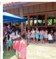
みんな大好きなかき氷

7月22日(土)、美浜区集会所で、お馴染みの交流サロンみはまちゃんが開催されました。高齢者保健福祉計画協働推進事業の一環として始まり、早くも3周年が経ちます。地域住民ボランティアの方たちの温かい料理は、今日も大人気です。今回は3周年を記念して、かき氷のふるまひがあり、子供たちで大にぎわいでした。 広報通信員 宮原 ゆかり