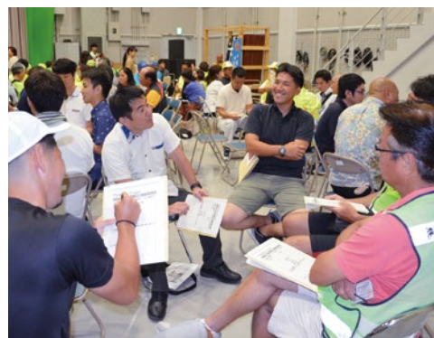
子どもの携帯電話使用について話し合う参加者