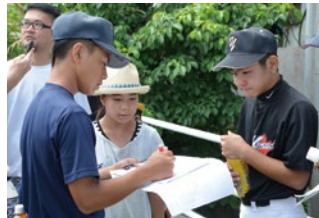
搜索箇所を地図で確認する子どもたち