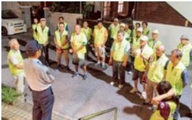
パトロール前の打ち合わせ

7月21日(金)、宮城区防犯分会では、美浜で行われた北谷町青少年育成町民大会と合わせて平成29年度第1回夜間防犯パトロールを行いました。本会は、地域住民の防犯思想の普及と高揚を図り、民警一体の防犯活動を推進しており、沖繩地区防犯協会と協力して防犯パトロールを実施しています。 この日は宮城区7班の皆さんを中心としたメンバーと、北前交番長と一緒にパトロールを行いました。一人の指導もなく無事に終了しました。 宮城区広報通信員 吉田 茂