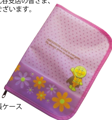
寄贈された親子健康手帳ケース