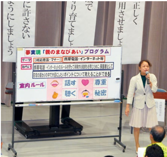
親のまなびあいプログラムの様子