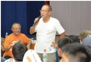
行方不明者役の男性無事発見! 暑い中お疲れ様でした。