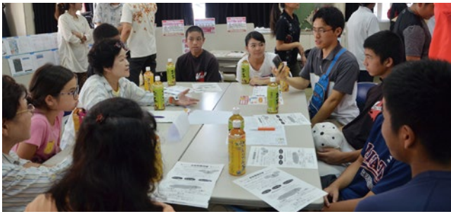
搜索前にグループの連携を確認する参加者

者役の2名を搜索する訓練内容で、スマートフォンアプリ等を用いて搜索範囲が重複しないように情報を共有する試みもあり、無事行方不明者役の2名を発見できました。 「目配り・気配り・声かけ」で高齢者にやさしい地域づくりを! 栄口区周辺を対象に行った今回の訓練で、約100名の参加者が一斉に搜索しても、行方不明者を見つけるのは簡単なことではありませんでした。このことから、道迷いを未然に防ぐための地域作りが重要だとわかります。地域の方々の見守りや声かけ等で、一人でも多くの認知症の方が安心して日々の生活を継続できるように地域をめぐらせていきましょう。