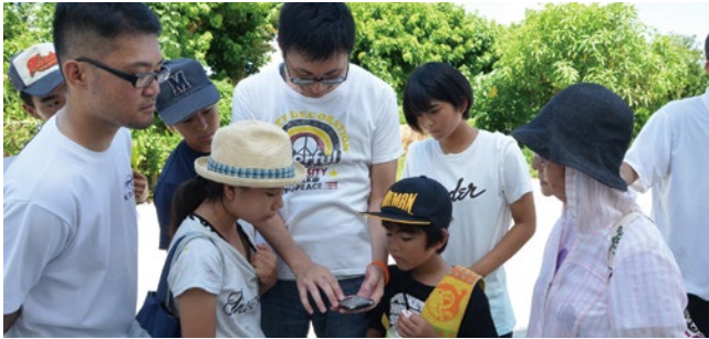
近くに行方不明者がいないかスマートフォンアプリで確認!(行方不明者役は発信機を持っており、近づくとうアプリケーションで確認できる仕組み)