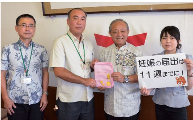
JAおきなわ北谷支店の皆さま、ありがとうございます。

妊娠中は普段よりも健康に気を付ける必要があるため、早めに妊娠届出を行い、定期的に健康診査を受けましょう。お母さんと赤ちゃんが安心・安全に妊娠・出産をするために早めの届出を行うことがとても大切です。