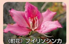
《町花》フリソシンカ