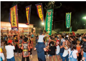
最後は皆でカチャーシー!