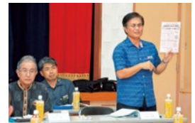
特定健診のお知らせの様子