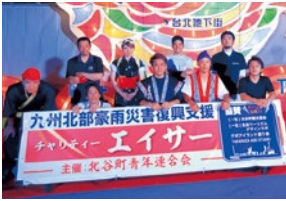
ご協力ありがとうございました。

7月22日(土)美浜デポアイランド海側駐車場にて、北谷町青年連合会主催の九州北部豪雨災害復興支援チャリティーエイサーが行われました。町内青年会、他、沖縄市の中の町青年会を迎えて盛大に演舞が披露されました。協賛であるデポアイランド通り会からはチャリティーTシャツの提供があり、募金活動と共に1枚1000円で販売しました。今回のチャリティーエイサーで集まった義援金は76,521円、Tシャツ売上は92枚で、全額九州北部豪雨災害復興の為に寄附させていただきます。皆様ご協力ありがとうございました。