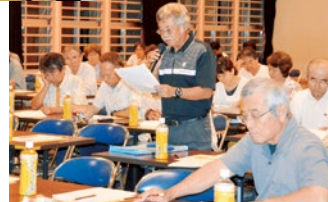
質問の様子(桑江区)