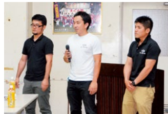
青年会長から町長へのお願いもありました。(栄口区)