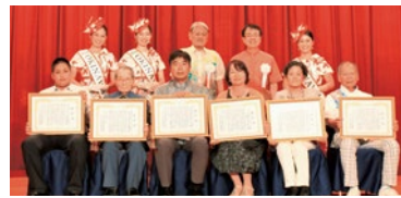
受賞おめでとうございます。

めんそーれ沖縄クリーンアップ キャンペーン表彰受賞! 8月1日(火)沖縄ハーバービュー(那覇市)で開催されました「めんそーれ沖縄県民運動推進協議会表彰式」にて、「ボランティアグループ・HOME」が沖縄県知事より「めんそーれ沖縄クリーンアップキャンペーン」の表彰を受けました。 同団体は、地域(各自治会、地域のボランティア団体等)と連携し、落書き消し活動やクリーンアップ活動等を町内にて積極的・継続的に行い、環境美化及び防犯活動に貢献しております。また、地域の子供たちの学習支援や非行防止についても取り組んでいます。受賞おめでとうございます!!