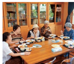
毎回和やかなムードです