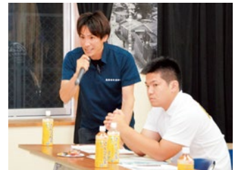
若者の意見も重要です。(北玉区の様子)