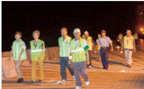
パトロールの様子