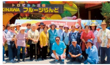
フルーツランドで記念写真

7月27日(木)日頃ボランティア活動をしているそれぞれのメンバー21名が交流を目的にしたバスハイイクを楽しみました。予定していた葡萄園では収穫が終了との事で、急遽OKINAWAフルーツランドに変更になりました。しかし、珍しい南国の果物や鳥に参加者から感嘆の声が上がりました。 昼食は「本部リゾートホテル」で懇談しながらのバイキングランチ、最後は「名護J.A.やるばる市場」でお土産も買い、メンバー同士の親睦を深めました。 宇地原区広報通信員 杉浦 好子