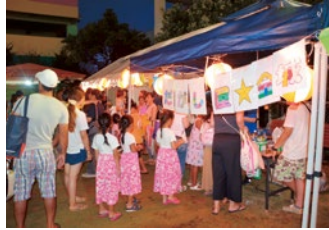
屋台に並び来場者の様子