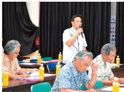
質問の様子(上勢区)