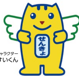
明るい選挙キャラクター 選挙のめいすいくん