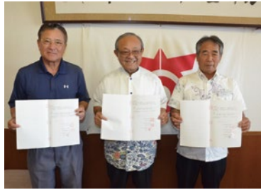
E-JI HOUSING様、ご理解ありがとうございます。

今後津波避難ビルの指定に向けた取り組みを継続するとともに、避難訓練を実施・検証しながら、本町の防災対応能力の向上に努めていきたいと思っております。