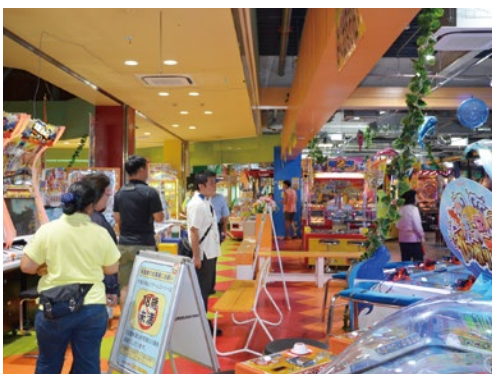
夜間街頭指導の様子(ゲームセンター内)

の一環である「夢実現親のまなびあいプログラム」では、参加者全員で子どもたちの携帯電話・インターネット利用のルール等について意見交換をしながら考えました。 大会後は、町内各地区に分かれて夜間街頭指導を行いました。