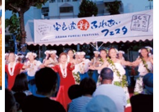
フラダンス公演の様子

北前区自治会は、7月8日、安良波公園広場で「安良波ふれあいフェスタ2017」を世代がつながる、地域でつながる、未来につながるを開催しました。本フェスタは、「高齢者保健福祉計画画協働推進事業」補助金を活用し、区政委員会・学推協・民生委員・老人会役員などで構成する実行委員会により取り組まれました。 当日は約500名が来場、多国籍屋台や多くの公演で盛り上がりました。特に舞台では、子どもからお年寄りまで幅広い団体の歌や踊りなどが披露され、大いに盛り上がりました。 また、北谷高校生のボランティア28名が、会場準備・運営をサポートするなど、地域と学校の連携強化にもつながる良い取り組みとなりました。