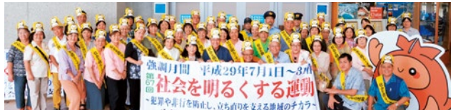
みんなで社会を明るくしましょう

7月3日(月)北谷町役場において「社会を明るくする運動」の出発式が行われました。本運動は、すべての国民が、犯罪や非行の防止と罪を犯した人たちの更生について理解を深め、それぞれの立場において力を合わせ、犯罪や非行のない安全で安心な地域社会を築こうとする全国的な住民運動で、毎年7月を強調月間としています。より多くの住民の方々の理解と参加を得て、本運動における諸活動が活発に行われますよう、ご協力をお願いいたします。