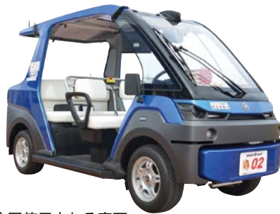
今回使用される車両。地中に埋められた電磁誘導線に沿って走行する。