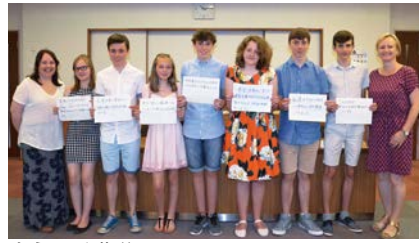
ようこそ北谷町へ

バセーションコンテストが開催予定で、ここで選ばれた4名の生徒が11月中旬頃、英国へ派遣される予定です。生徒の皆さん、頑張ってください。