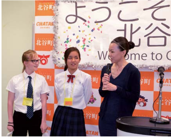
ホームステイよろしくお願いします。

でホームステイをし、観光では味わえないリアルな日本の生活を学ぶことができました。 9月1日には北谷町中学生英語スピーチ及びカン