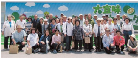
暑さに負けず楽しみました