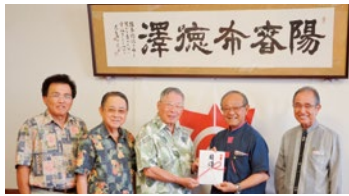
改めて絆を再確認しました

7月1日(土)、北玉児童館にてハッピー縁日が行われました。天気にも恵まれ、多くの子どもたちや保護者が集まりました。多種多様なゲームコーナーや食べ物を用意され、子どもたちは特に景品のおもちゃに目を輝かせていました。かき氷片手にゲームを楽しみ子ども達の姿に、自然と笑顔になれる涼しげな縁日になりました。