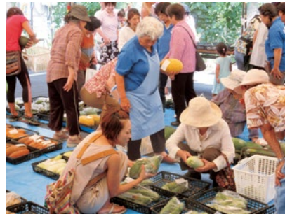
いろいろな野菜に目移り