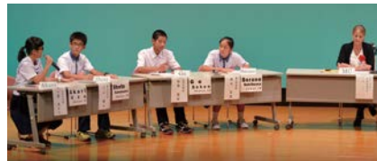
去年のカンパセーションコンテスト