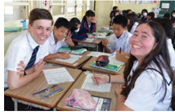
学校訪問の様子(北谷中学校)

平成29年度英国派遣交流事業の一環として、6月30日から7月7日までの間、ディーンマグナススクール(英国)の訪問団を北谷町にお迎えしました。引率教諭2名・生徒7名、総勢9名の訪問団は、北谷町の歴史・文化について学び、さらに町内小中学校(北玉小・桑江中・北谷中)を訪問し、町内小中学生との交流を深めました。また、英国の生徒達は町内の家庭