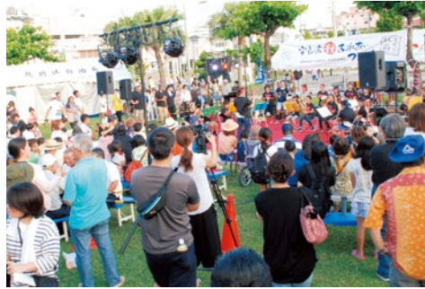
大盛り上がりの安良波公園