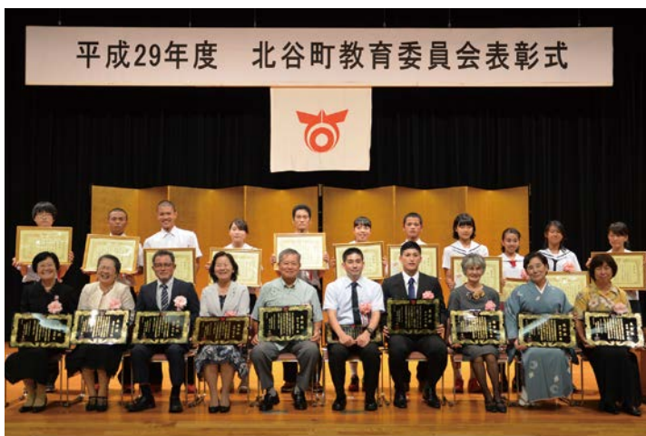
平成29年度 北谷町教育委員会表彰式