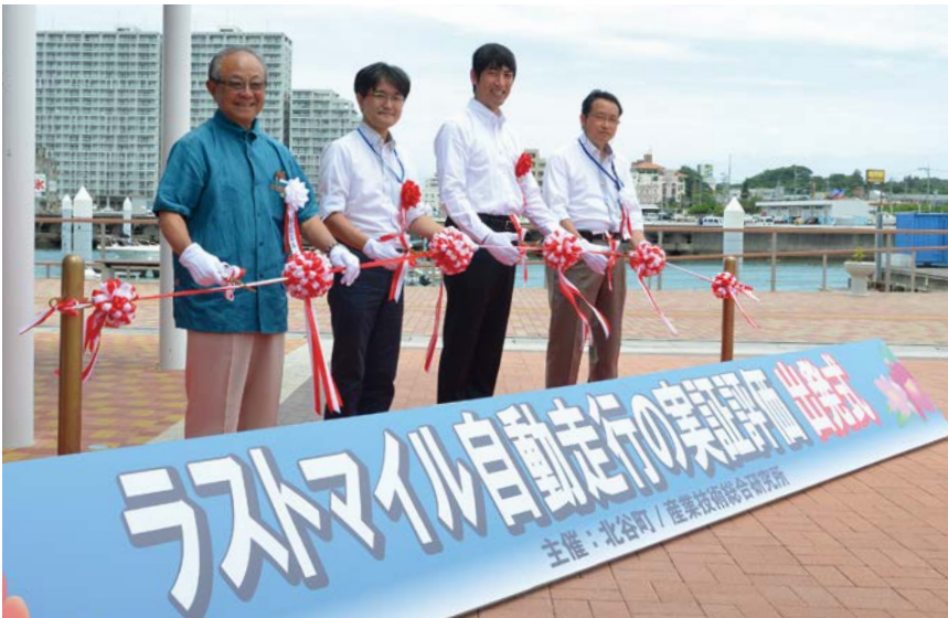
左から野国町長、久保田氏(国交省)、奥田氏(経産省)、加藤氏(産総研)

本町は全国初の観光地モデルとして実証実験地域に選ばれ、これから実用化に向けて実験・検証を重ねていきます。将来、実用化されれば、住民や観光客の移動利便性の向上や、新たな地域振興につながるものと期待しています。実証実験については、周辺利用者への配慮・安全管理を徹底してまいります。実証実験の詳細な内容等については、企画財政課までお問い合わせください。