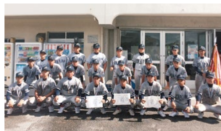
優勝した北谷ボーイズ

中学硬式野球ボーイズリーグの第48回日本少年野球選手権沖縄大会が6月24日までに具志川球場ほかで行われ、決勝で北谷ボーイズが南風原ボーイズを4-0で下し、見事優勝しました。北谷ボーイズには町内外の中学生が在籍しており、多くの町内中学生が活躍しています。優勝した北谷ボーイズは、8月2日から6日まで行われる全国大会(開催地：大阪)に出場します。応援よろしく申し上げます。