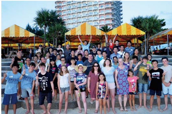
また北谷町に来てください！